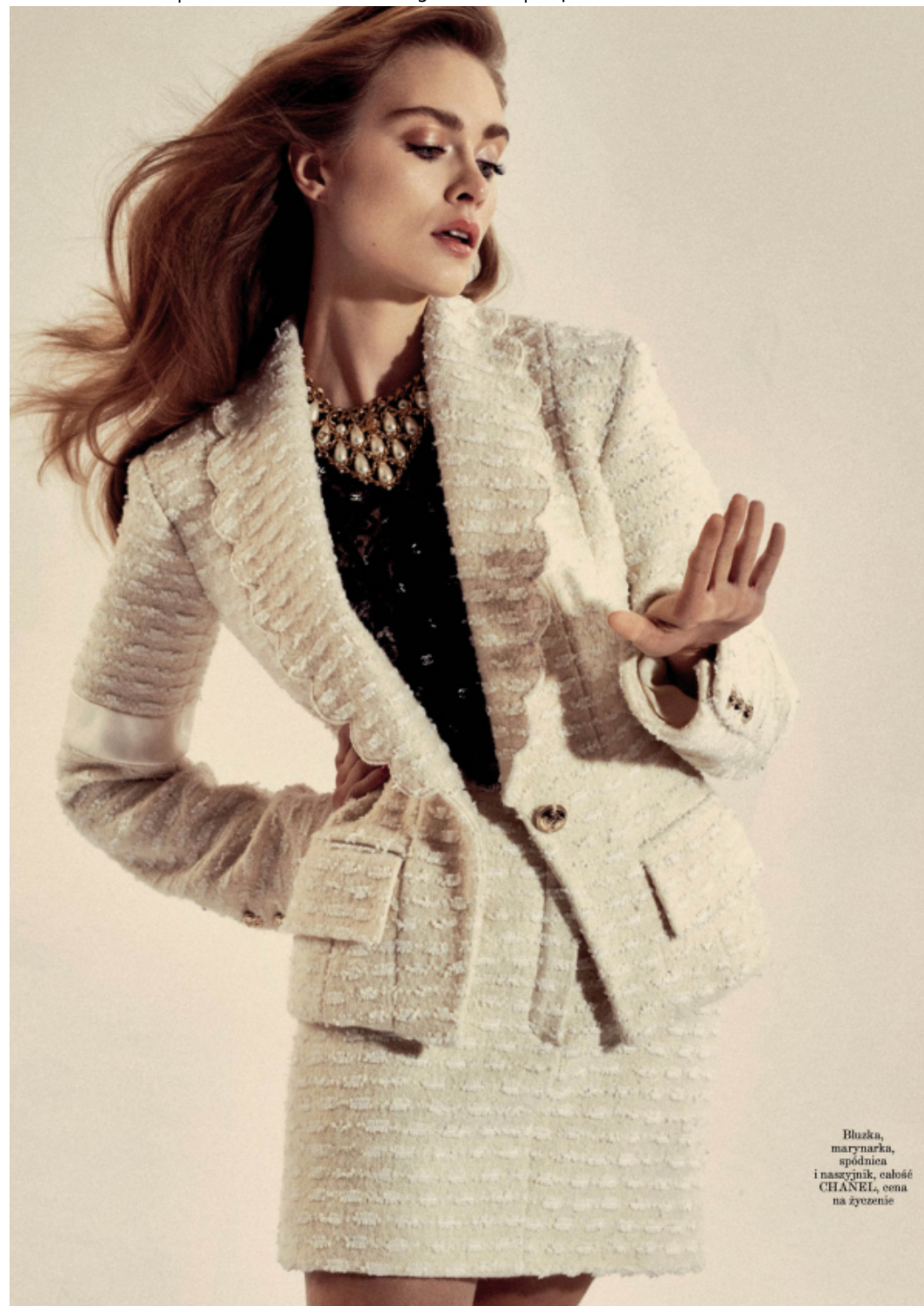
Bluзка, marynarka, spódnica i naszyjnik, całość CHANEL, cena na życzenie