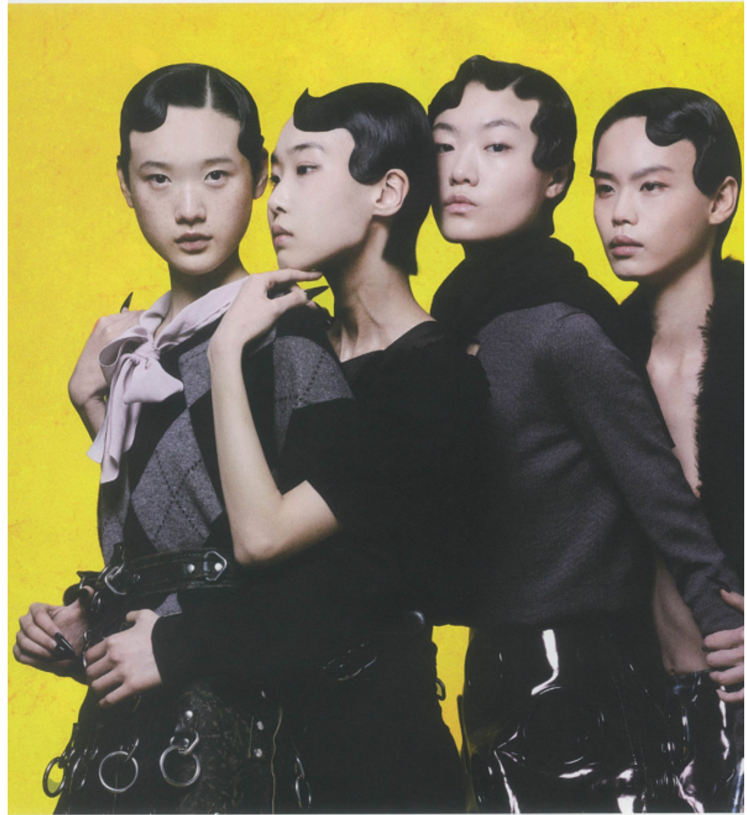
De gauche à droite : pull en laine, chemise en crêpe et jupe en cuir avec ceinture, PRADA. Haut et jupe en coton avec ceinture, PRADA. Pulls en laine et jupe en cuir verni, PRADA. Manteau en shearling et jupe en cuir verni, PRADA.