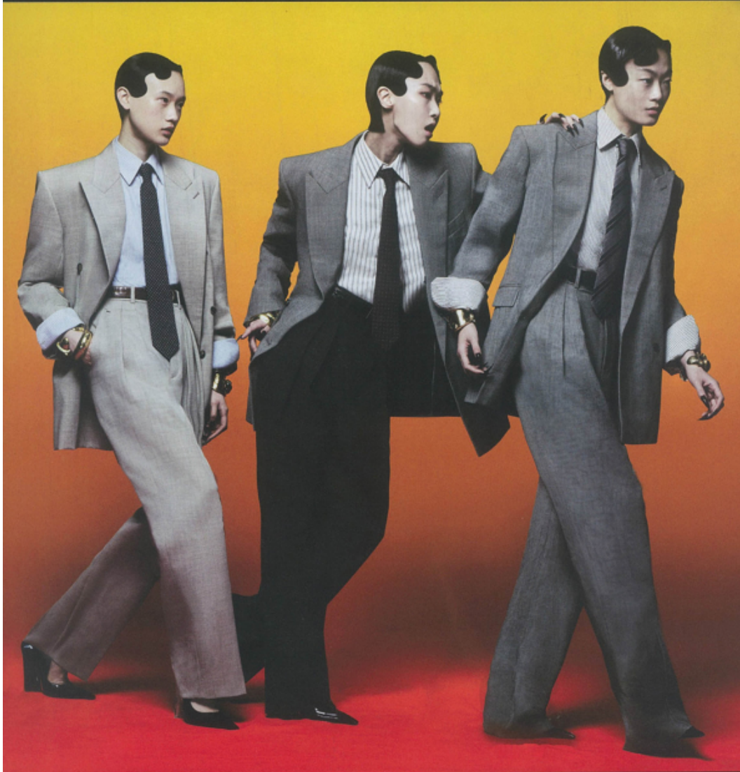
Vestets et pantalons en laine, chemises en coton, cravates, ceintures, bracelets et chaussures, SAINT LAURENT PAR ANTHONY ACCARELLO.