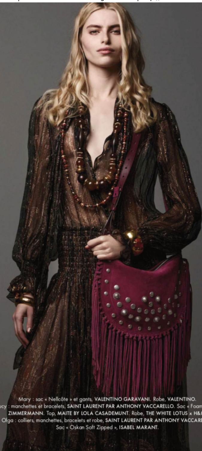
Mary : sac « Nellcôte » et gants, VALENTINO GARAVANI. Robe, VALENTINO. Lucy : manchettes et bracelets, SAINT LAURENT PAR ANTHONY VACCARELLO. Sac « Foam Bag », ZIMMERMANN. Top, MAITE BY LOLA CASADEMUNT. Robe, THE WHITE LOTUS x H&M. Olga : colliers, manchettes, bracelets et robe, SAINT LAURENT PAR ANTHONY VACCARELLO. Sac « Oskan Soft Zipped », ISABEL MARANT.