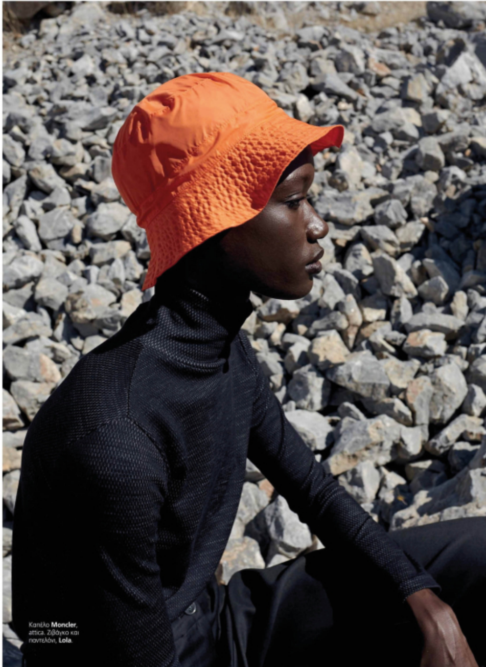
Καπέλο Moncler , ατσικά, Zibbyko και νοστέλινο, Lola .