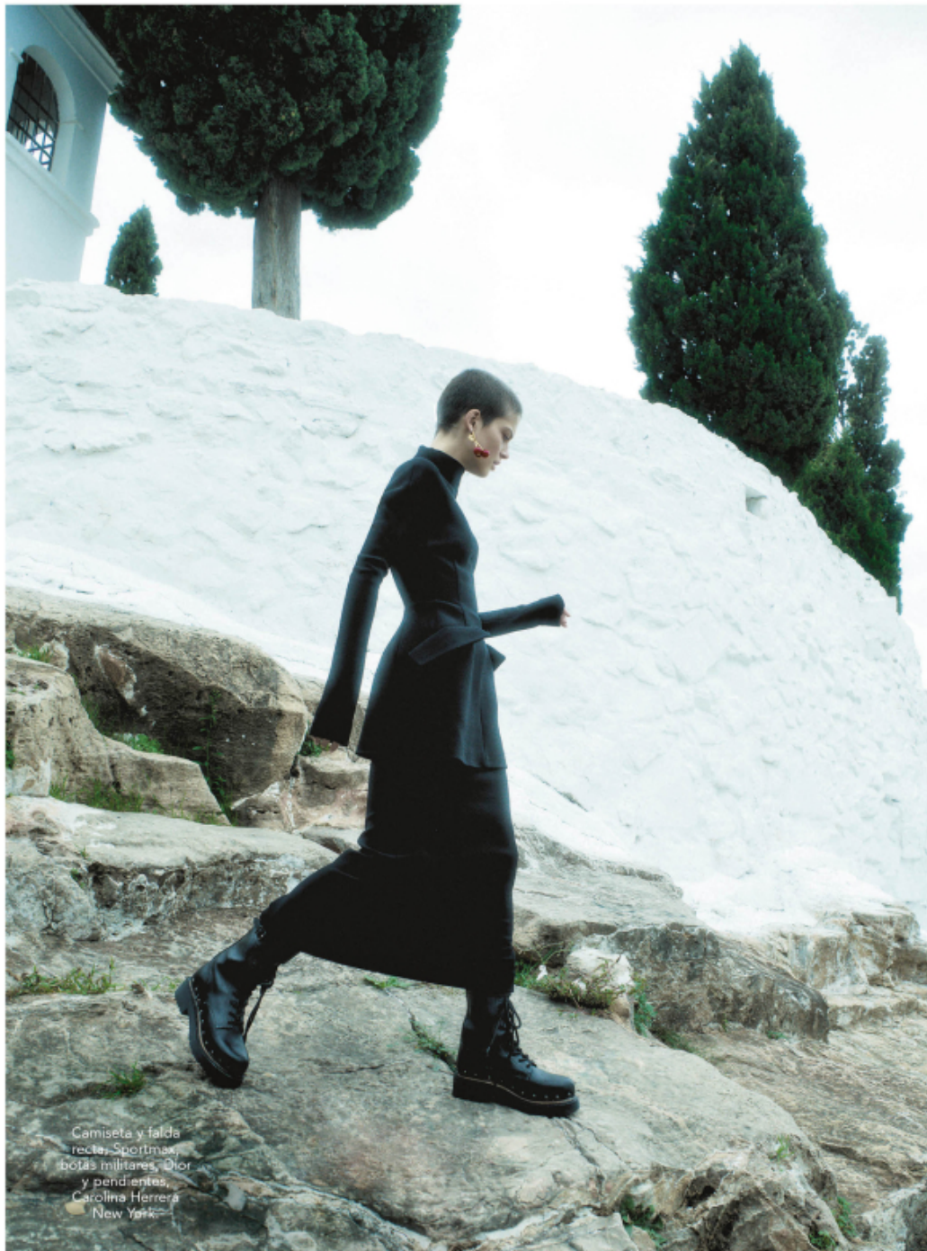
Camiseta y falda recta, Sportmax, botas militares, Dior y pendientes, Carolina Herrera New York.