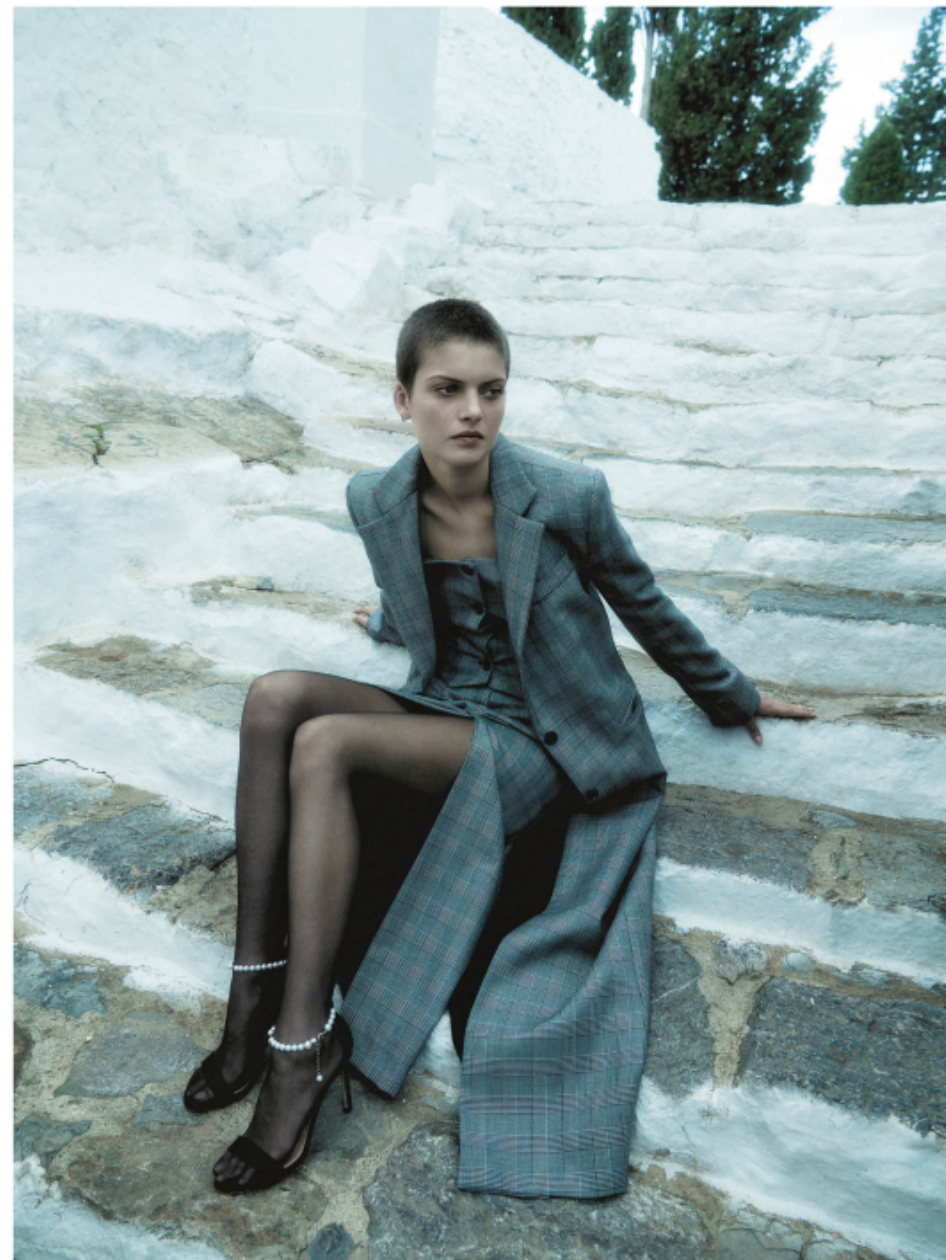
Chaleco, falda y abrigo príncipe de Gales, todo de Bleiss Madrid. Medias, Wolford y sandalias, Manolo Blahnik.