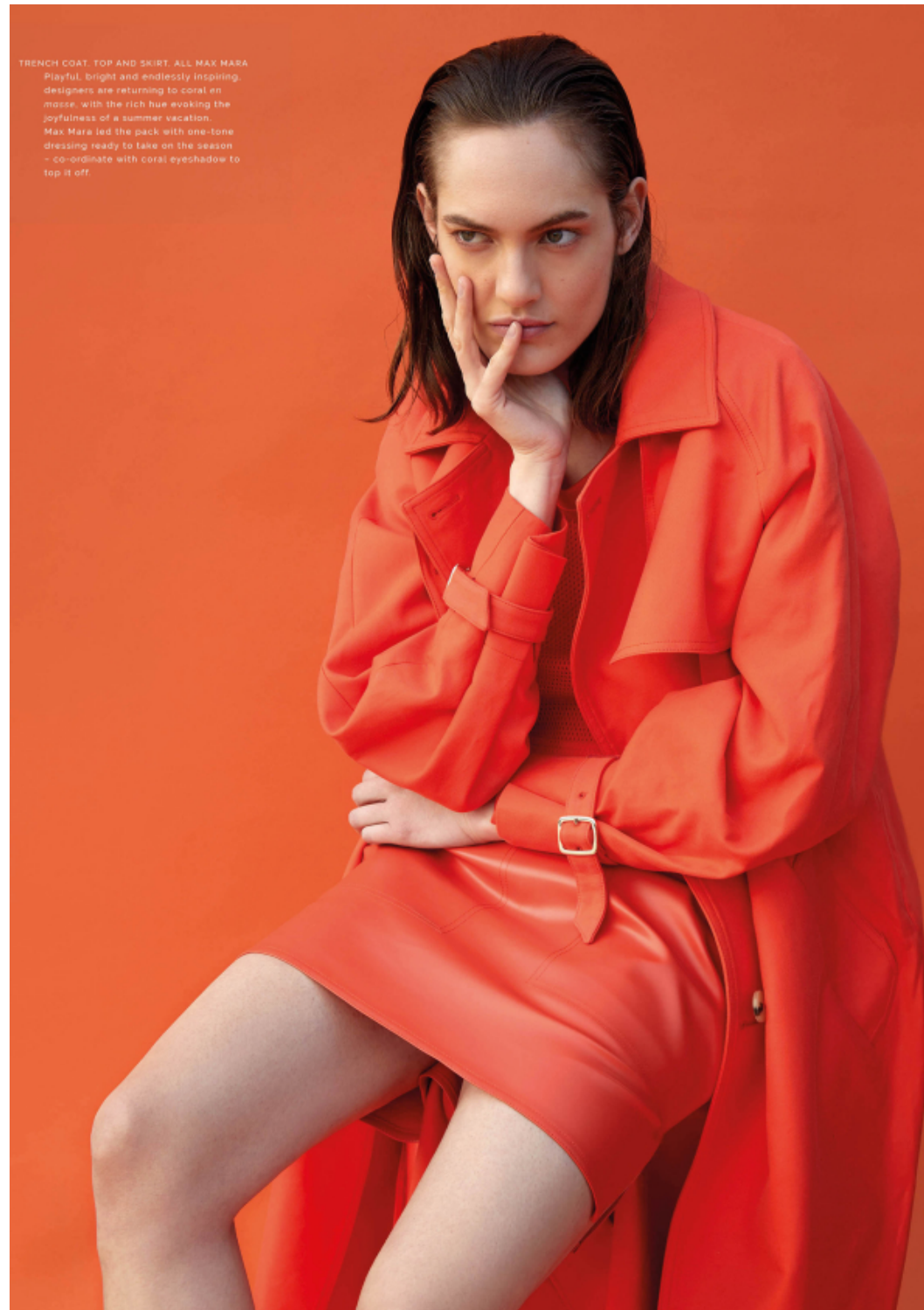
TRENCH COAT, TOP AND SKIRT, ALL MAX MARA Playful, bright and endlessly inspiring, designers are returning to coral en masse, with the rich hue evoking the joyfulness of a summer vacation. Max Mara led the pack with one-tone dressing ready to take on the season - co-ordinate with coral eyeshadow to top it off.