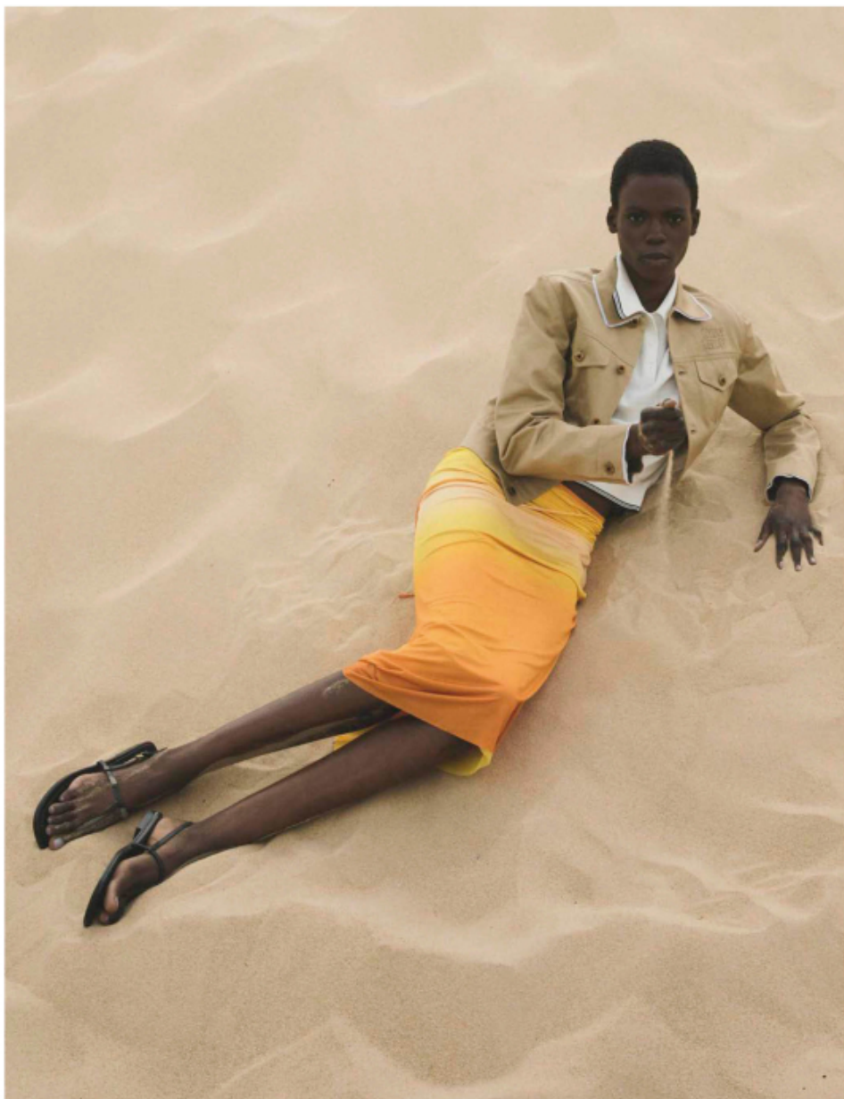
Polo y chaqueta de algodón, ambos de MIU MIU; falda de viscosa, de DESIGUAL; y sandalias de piel, de MICHAEL KORS COLLECTION.