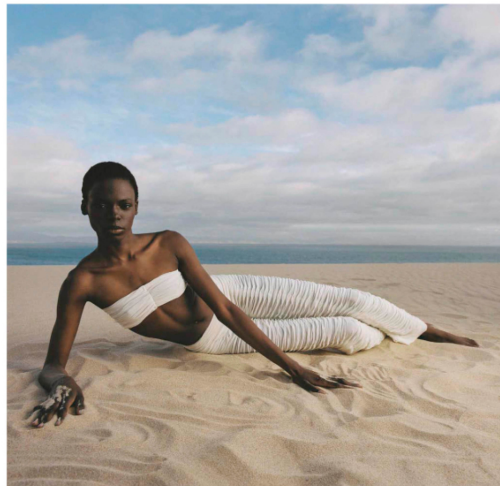
Top y pantalón de seda y viscosa, ambos de ISABEL MARANT.