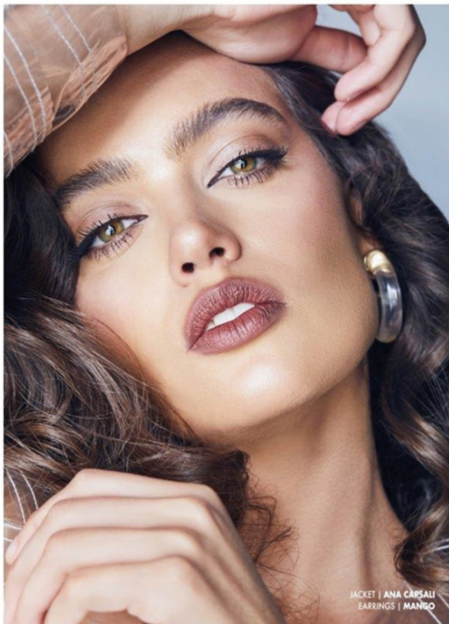
JACKET | ANA CAPŞALI EARRINGS | MANGO