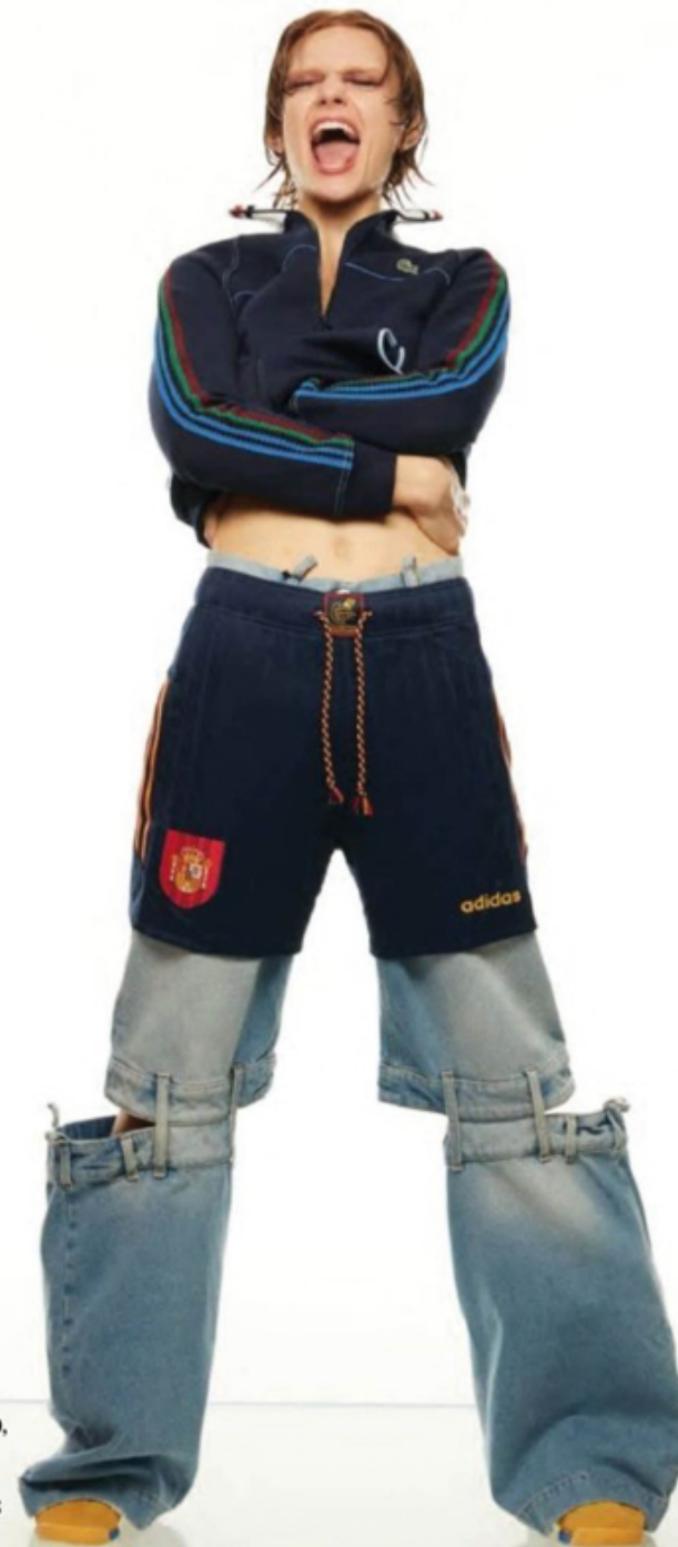
Hırka, LACOSTE Denim pantolon, THE ATTICO, BEYMEN Şort, ADIDAS ORIGINALS Sneaker, ADIDAS ORIGINALS