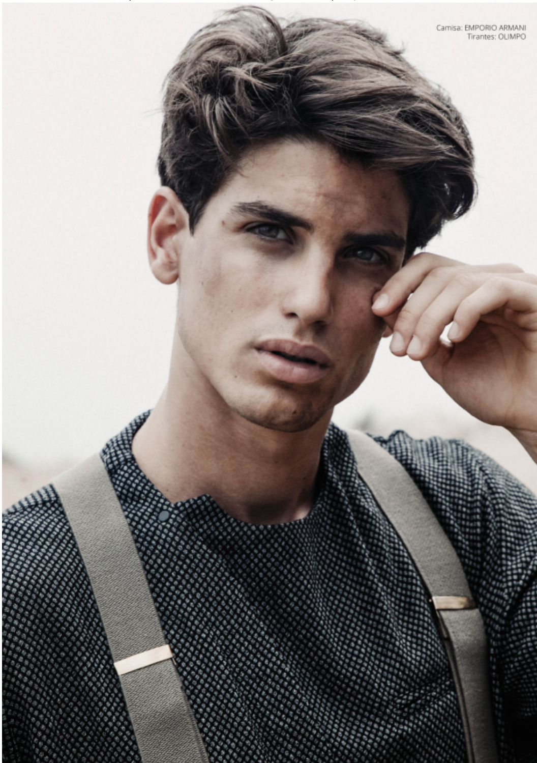
Camisa: EMPORIO ARMANI Tirantes: OLIMPO