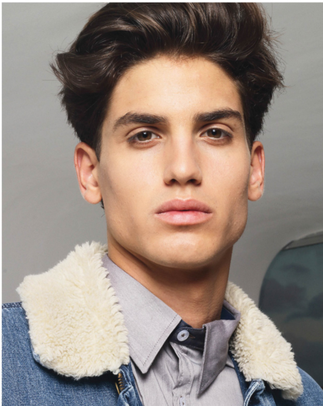
Denim Jacket CARHARTT WIP + Camisa ARAGAZA