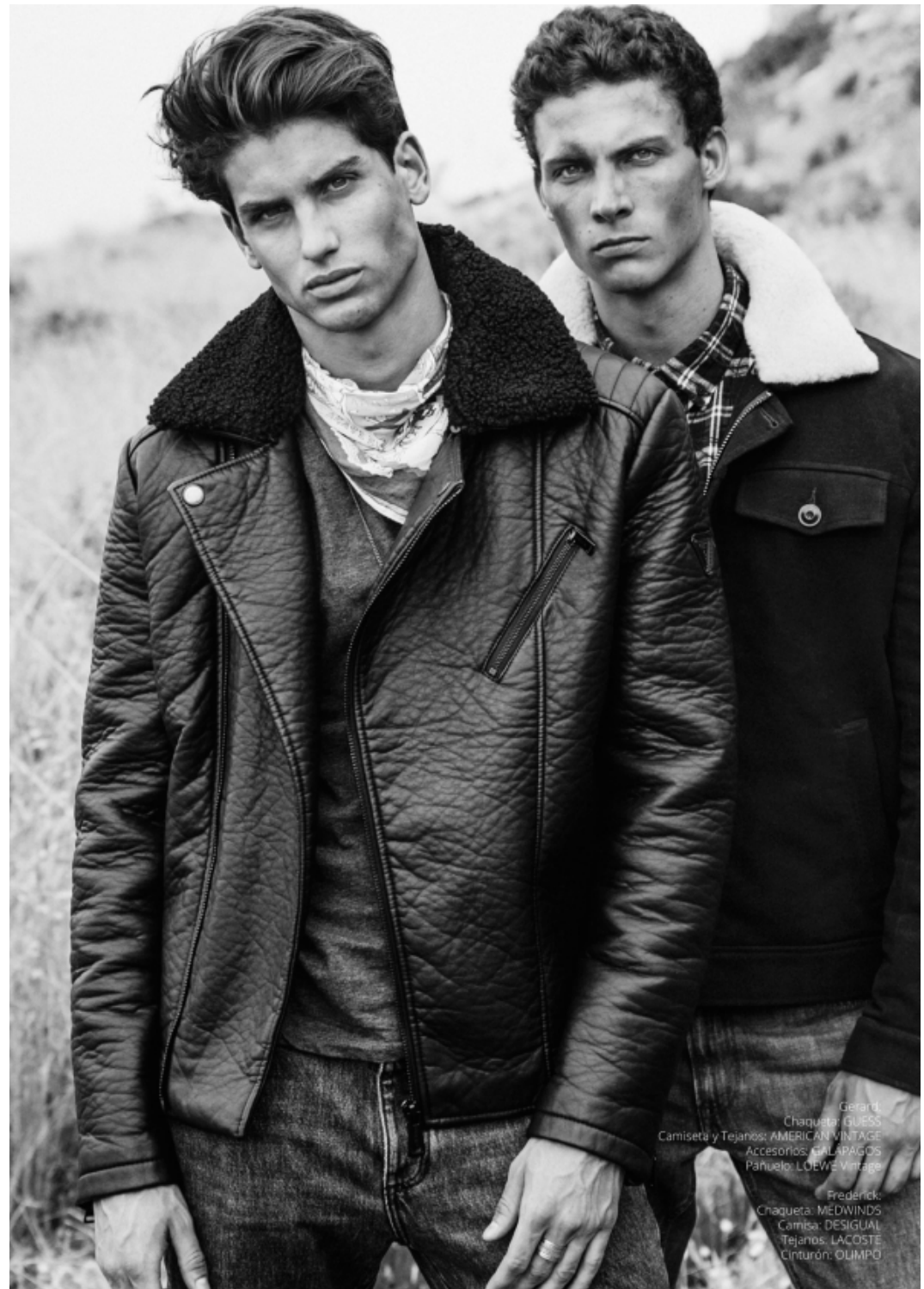
Gerard: Chaqueta: GUESS Camiseta y Tejanos: AMERICAN VINTAGE Accesorios: GALAPAGOS Pañuelo: LOEWE Vintage