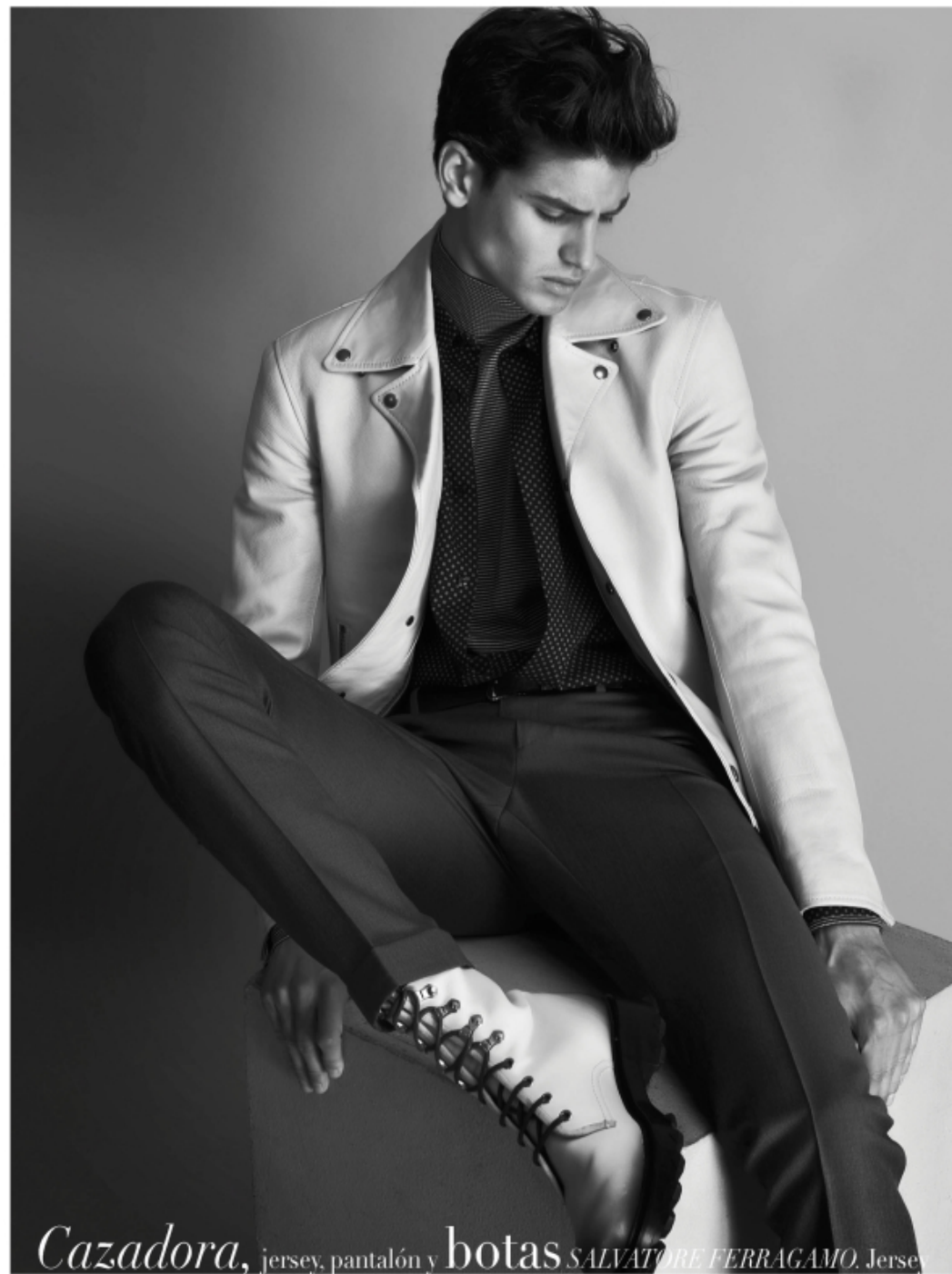
Cazadora , jersey, pantalón y botas SALVATORE FERRAGAMO. Jersey cuello alto BOSS. Camisa ANTONY MORATO. Cinturón EMPORIO ARMANI.