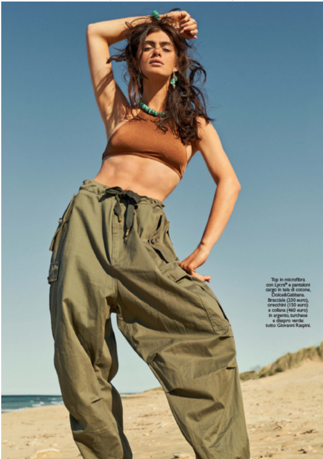
Top in microfibra con Lycra® e pantaloncini cargo in tela di cotone, Dolce&Gabbana. Bracciale (230 euro), orecchini (150 euro) e collana (460 euro) in argento, turchese e diaspro verde; tutto Giovanni Raspini.