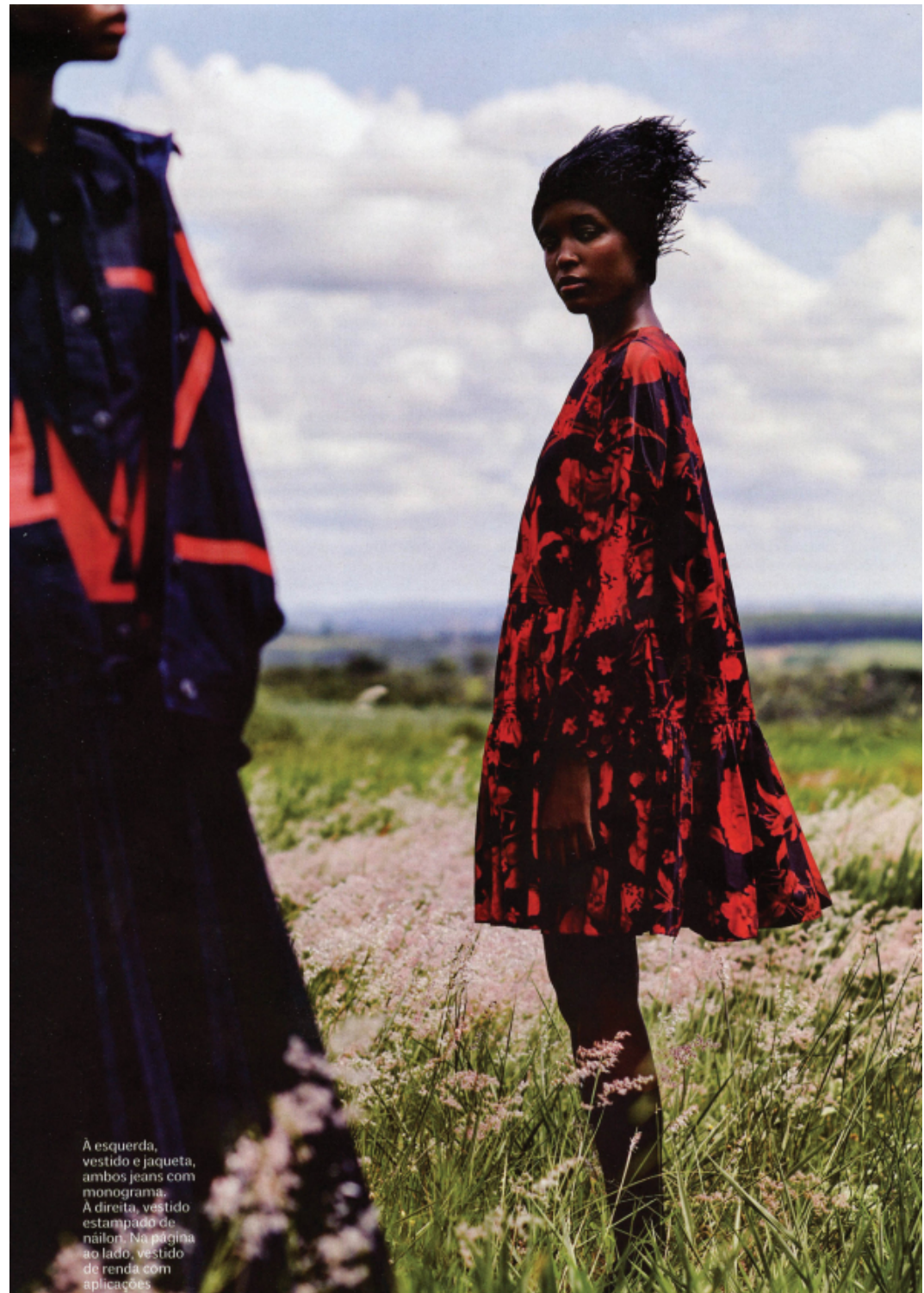
À esquerda, vestido e jaqueta, ambos jeans com monograma. À direita, vestido estampado de náilon. Na página ao lado, vestido de renda com aplicações