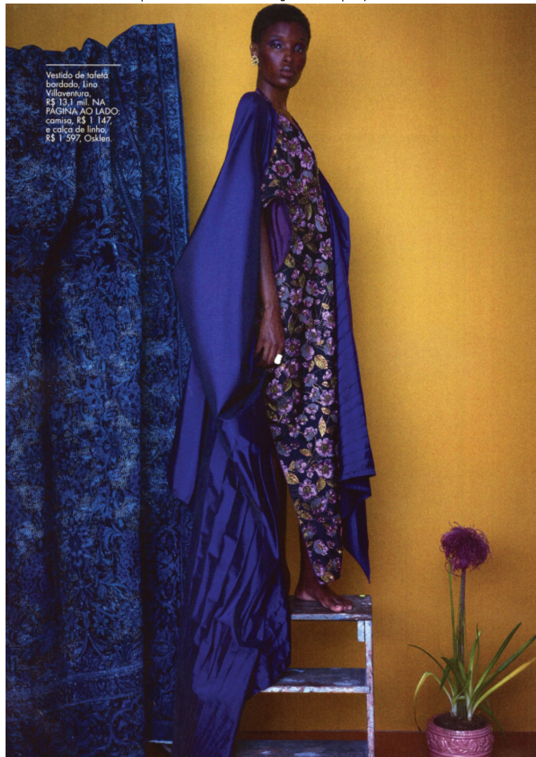
Vestido de tafetá bordado, lino Villaventura, R$ 13,1 mil. NA PAGINA AO LADO: camisa, R$ 1.147, e calça de linho, R$ 1.597, Osklen.