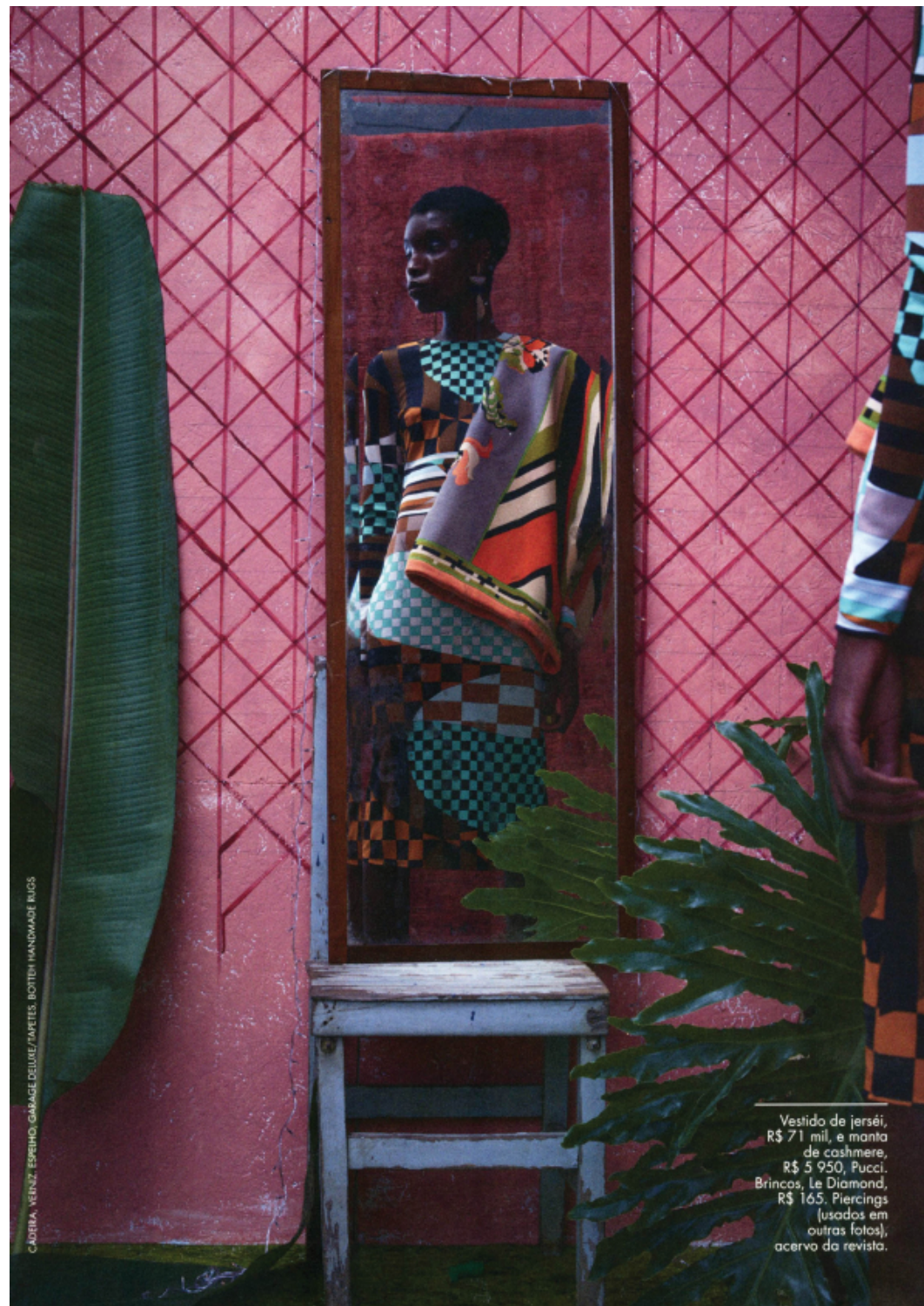
CADERNIA, VÊNIZ, ESPRIMO, GARAGE DELUXE/TAPETES, BOTTEI HANDMADE BUGS