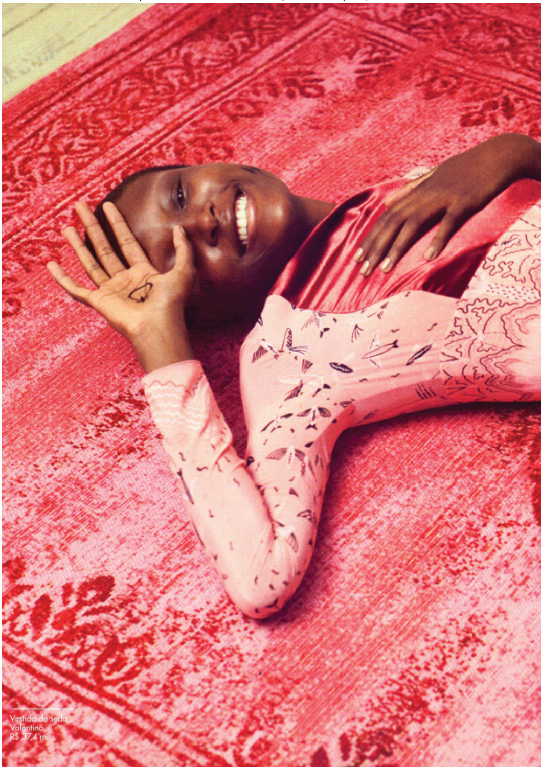
Vestido de seda Valentino, R$ 37,4 mil