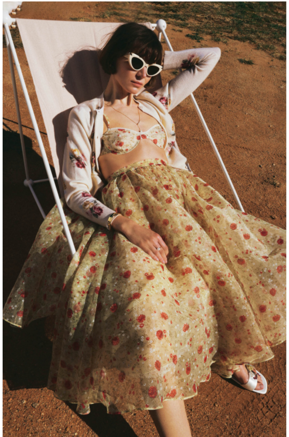
Bedeckte Strickjacke aus einem Woll-Mix, weiler Tüllrock mit floralem Muster, passender Unterrock, Biegel-BH, satinierte Sandaletten; alles Prada . Cat-Eye-Sonnenbrille: Alexander McQueen . 14-karätig vergoldete Kette mit Süßwasserzuchtperlen, skulpturaler Armband „Essence“; alles Pandora .