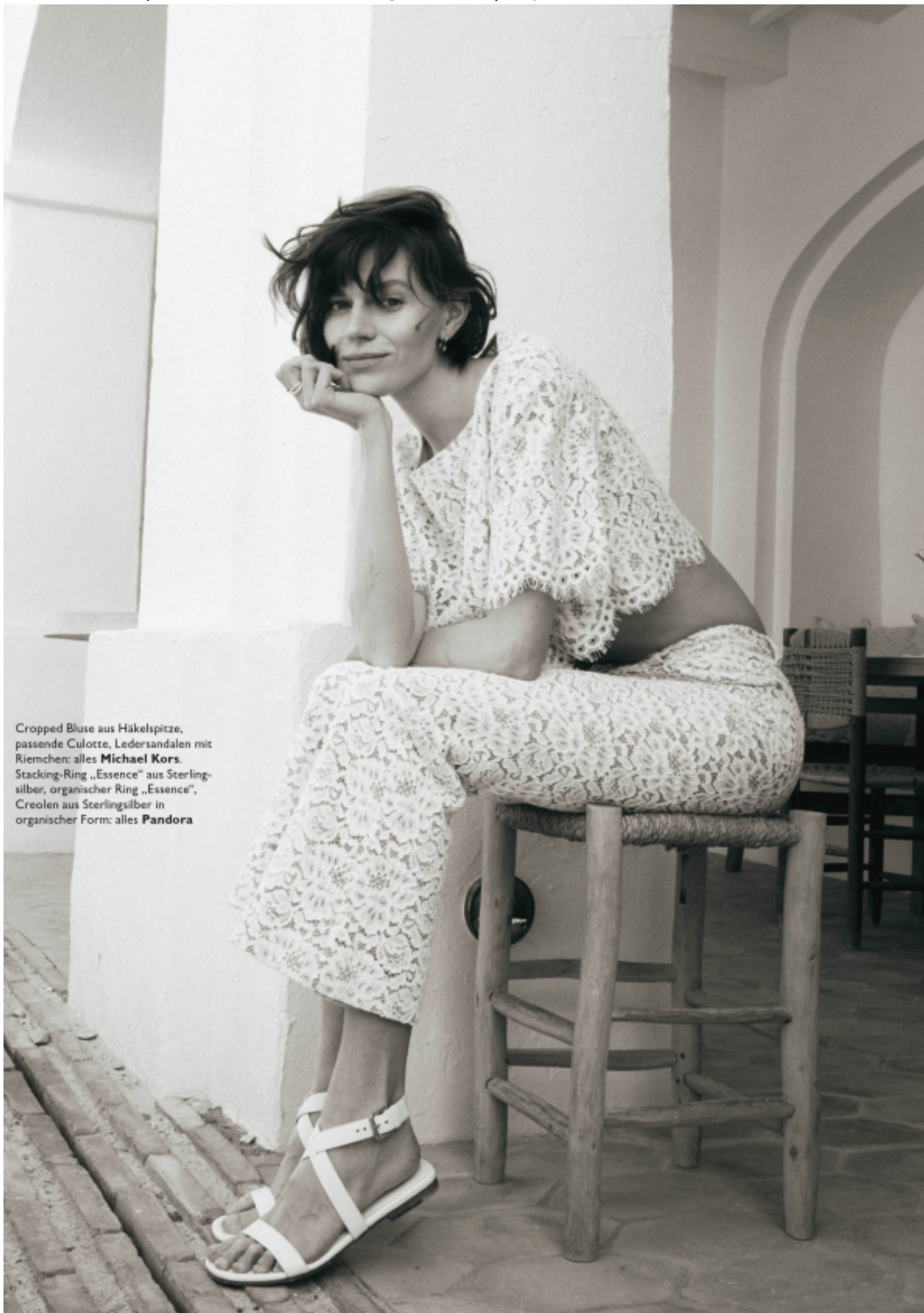
Cropped Bluse aus Häkelspitze, passende Culotte, Ledersandalen mit Riemchen: alles Michael Kors . Stacking-Ring „Essence“ aus Sterling-silber, organischer Ring „Essence“, Creolen aus Sterlingsilber in organischer Form: alles Pandora