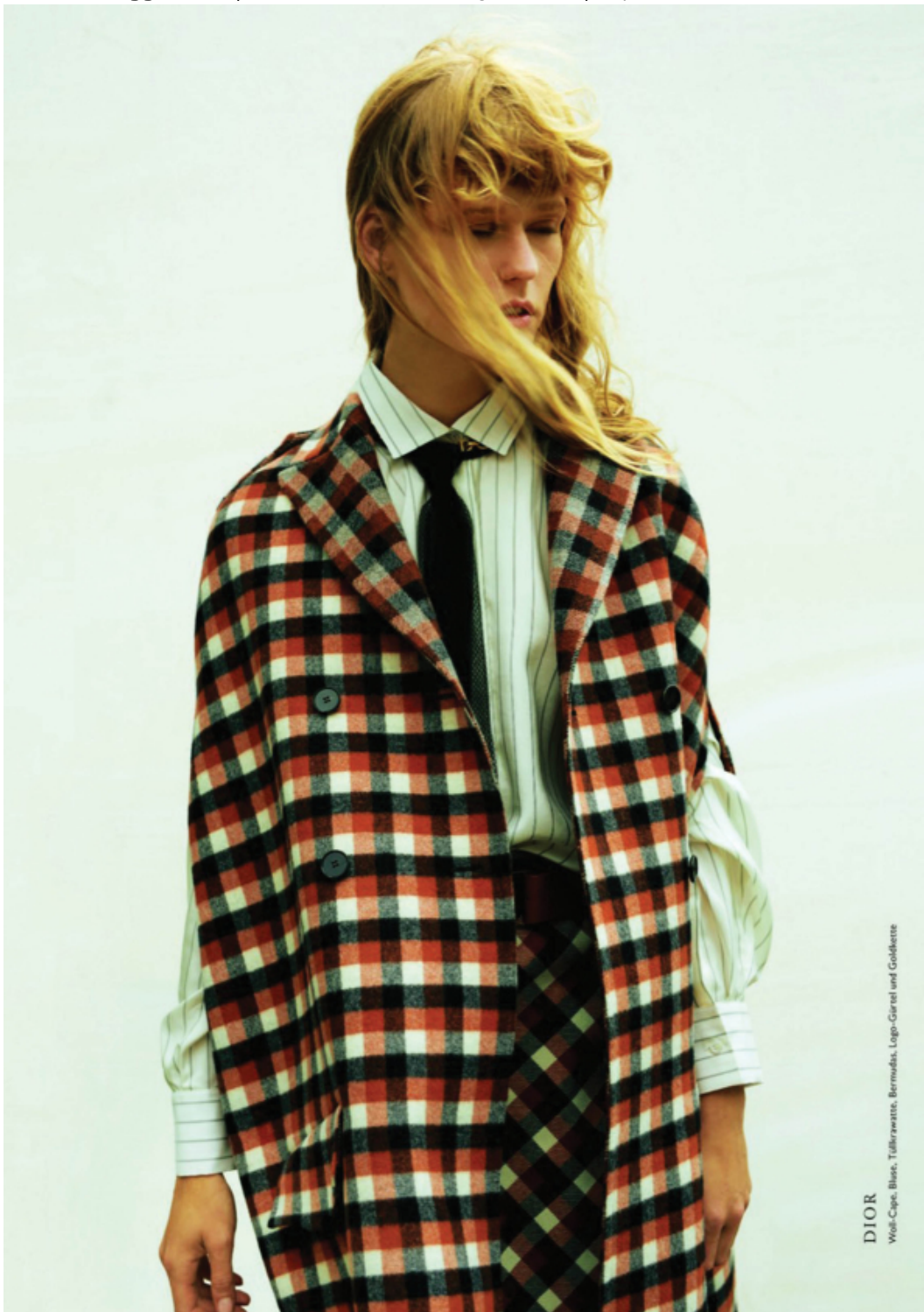
DIOR Woll-Cape, Blies, Tüllkravatte, Bermuda, Logo-Gürtel und Goldkette