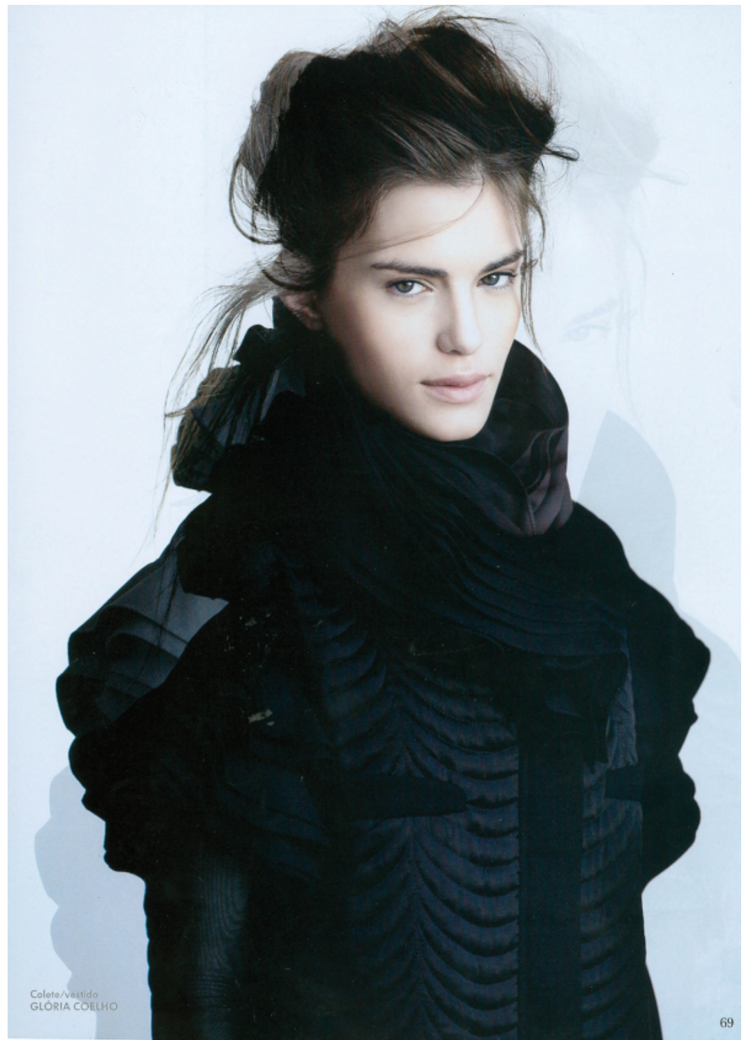
Colete/Vestido GLÓRIA COELHO