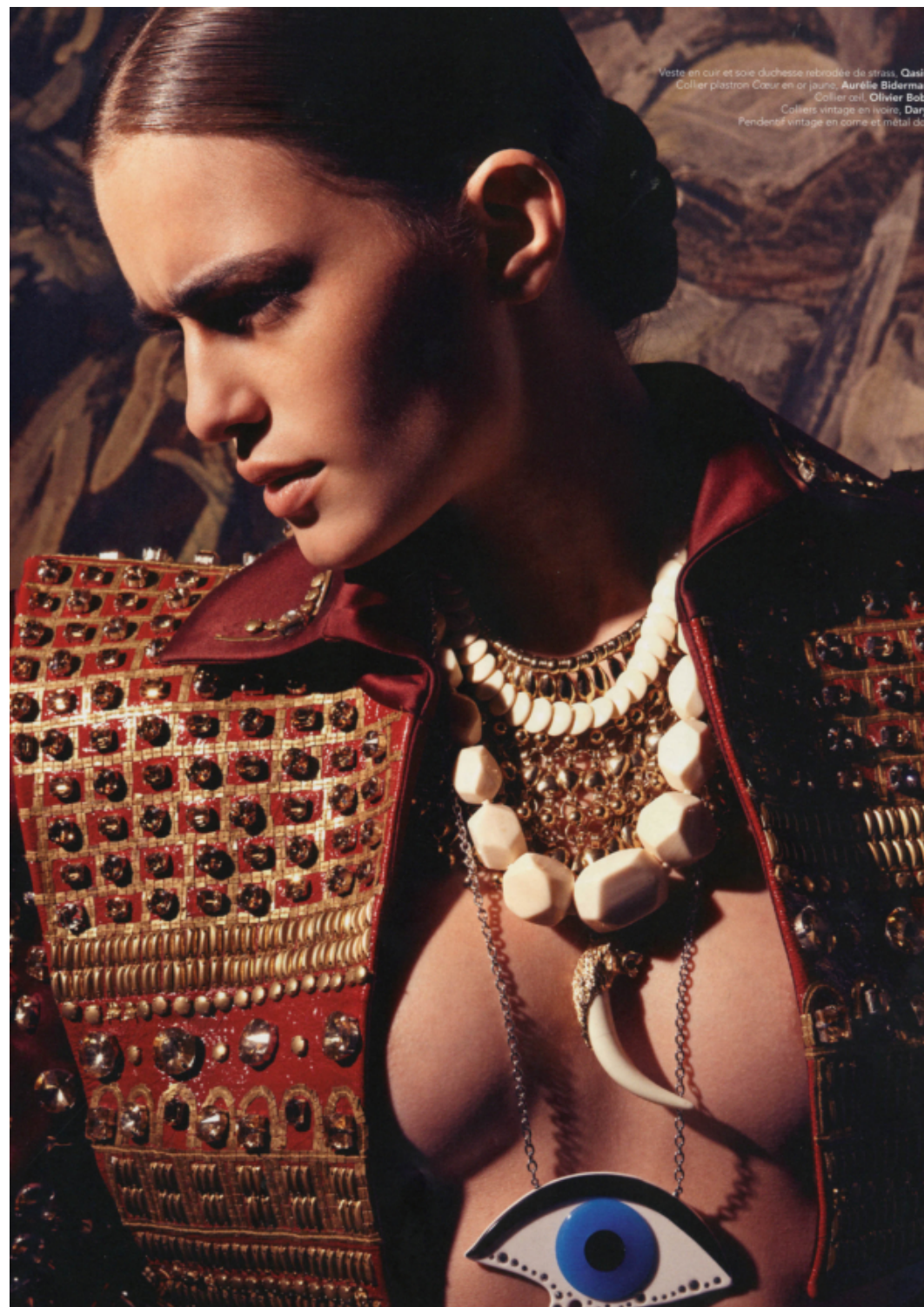
Veste en cuir et soie duchesse brodée de strass, Oastin. Collier plastron Cœur en or jaune, Aurélie Bidermann. Collier azté, Olivier Bobin. Colliers vintage en noir, Dary. Pendentif vintage en corne et métal doré, Harpo.