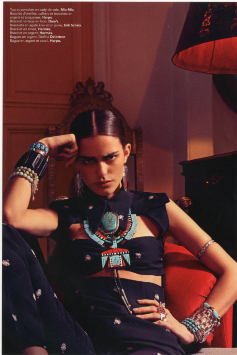
Top et pantalon en cady de soie, Miu Miu. Boucles d'oreilles, colliers et bracelets en argent et turquoises, Harpo. Bracelet vintage en bois, Dary's. Bracelets en agate kiwi et or jaune, Erik Schaix. Bracelet en émail, Hermès. Bracelet en argent, Hermès. Bagues en argent, Delfina Delettrez. Bague en argent et corail, Harpo.