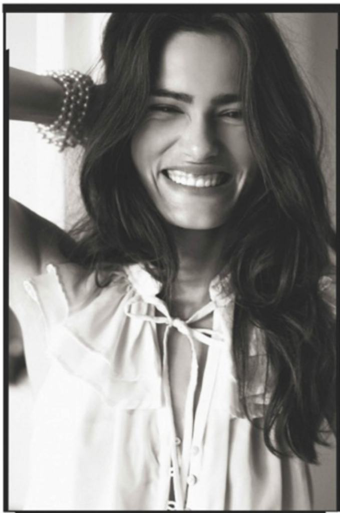
White ruffle top Lucky & Coco