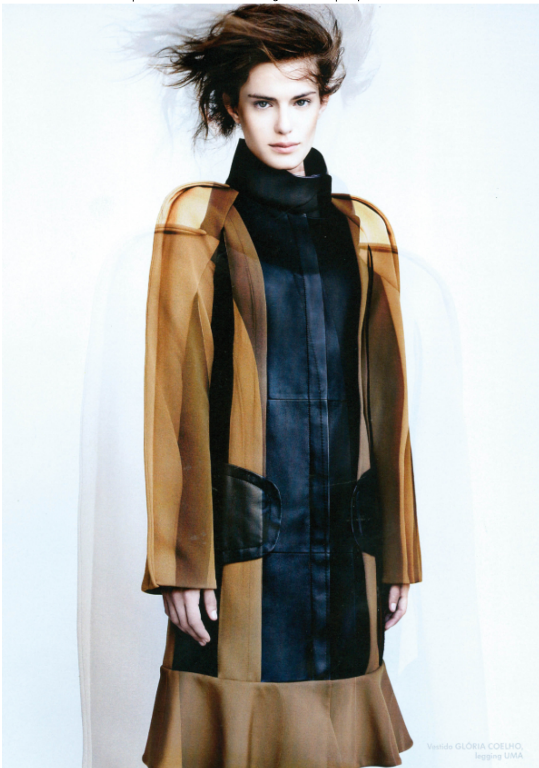
Vestido GLÓRIA COELHO, legging UMA