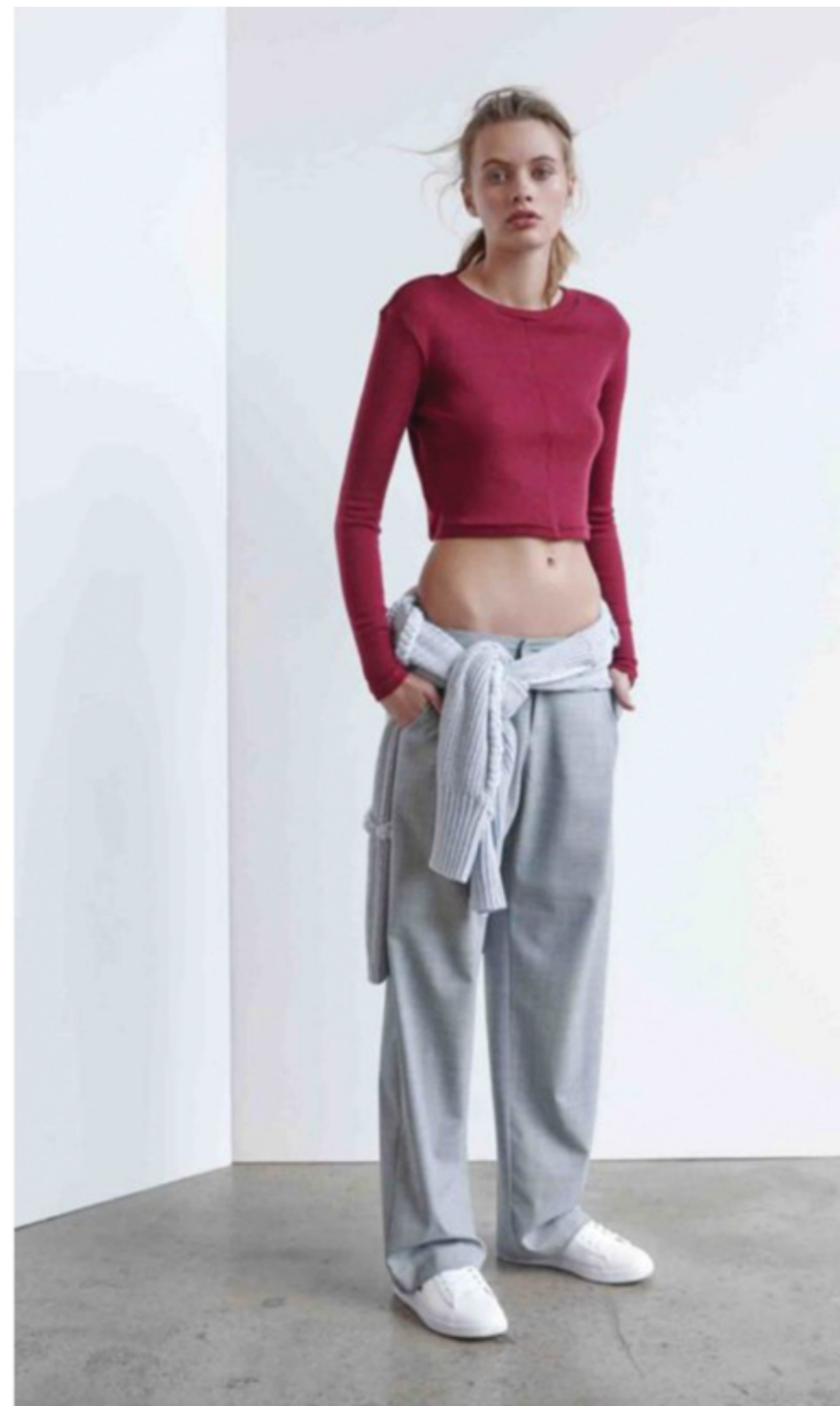
W393 SAILOR CROP SWEATER HULBERRY | WV126 JETTA WIDE PANT GREY | WN100-2 CHARMING PLAID SWEATER CHROME