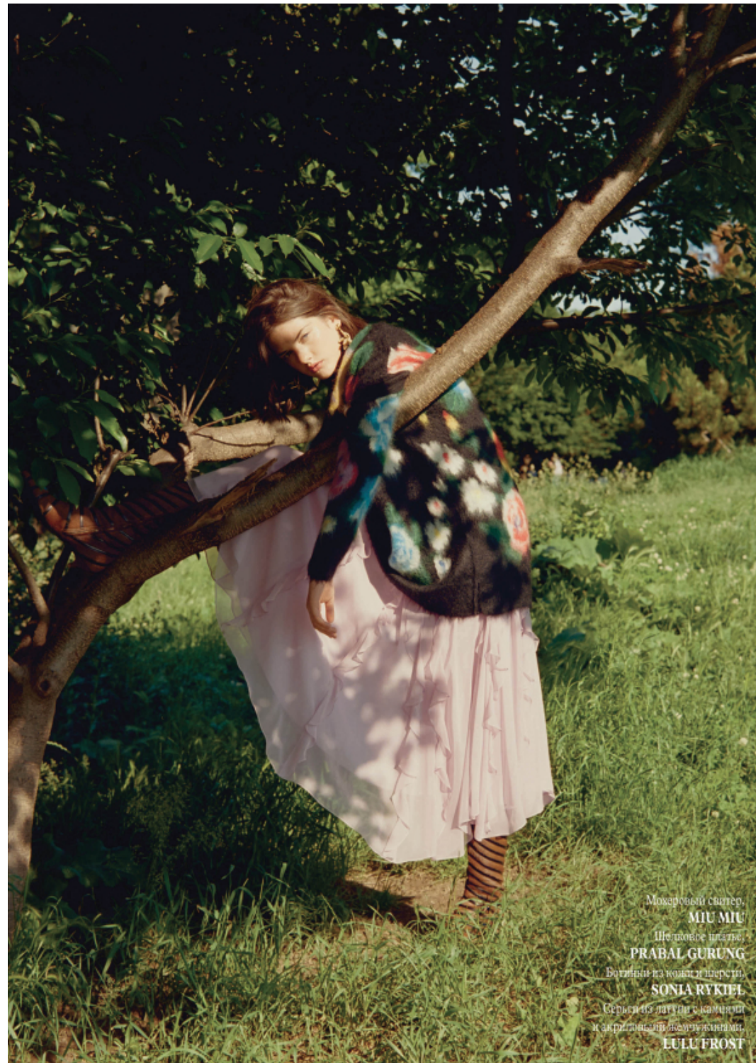
Мохеровый свитер, MIU MIU Шелковое платье, PRABAL GURUNG Ботильоны из кожи и персти, SONIA RYKIEL Серьги из лагуны с жемчужинами и акриловыми дисками в виде мш, LULU FROST