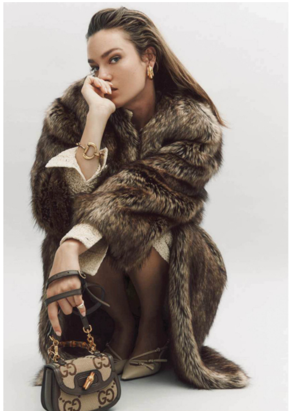
Manteau, chemisier, jupe, bracelet et sac, GUCCI . Boucles d'oreilles, DAPHINE . Chevalière en or jaune et diamants, ARTHUS BERTRAND . Collant et escarpins, MIU MIU .