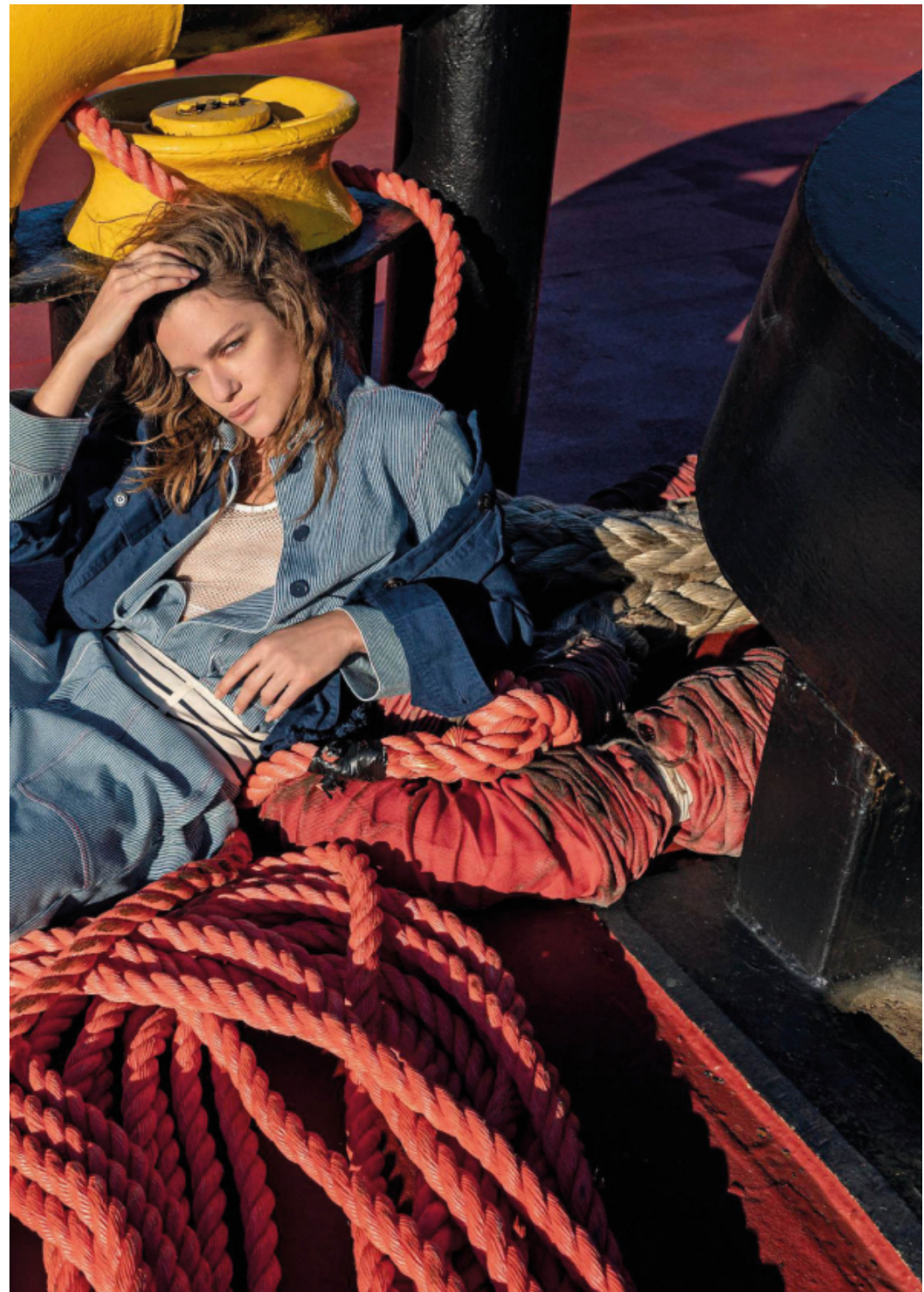
Field jacket di cotone tinto in capo (299 euro) su giacca di jersey misto cotone (149 euro) e pantaloni di jersey (129 euro), tutto Max & Co.; top a rete, Hui Milano, slip di cotone, Petit Bateau (35 euro la confezione da due), calze vintage.