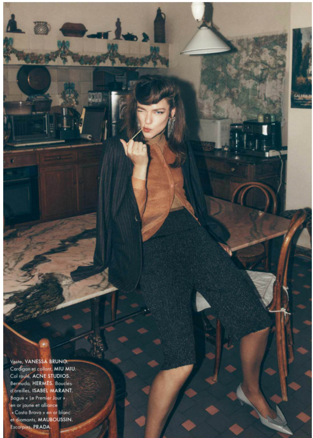
Veste, VANESSA BRUNO. Cardigan et collant, MIU MIU. Col roulé, ACNE STUDIOS. Bermuda, HERMÈS. Boucles d'oreilles, ISABEL MARANT. Bague « Le Premier Jour » en or jaune et alliance « Costa Brava » en or blanc et diamants, MAUBOUSSIN. Escarpins, PRADA.