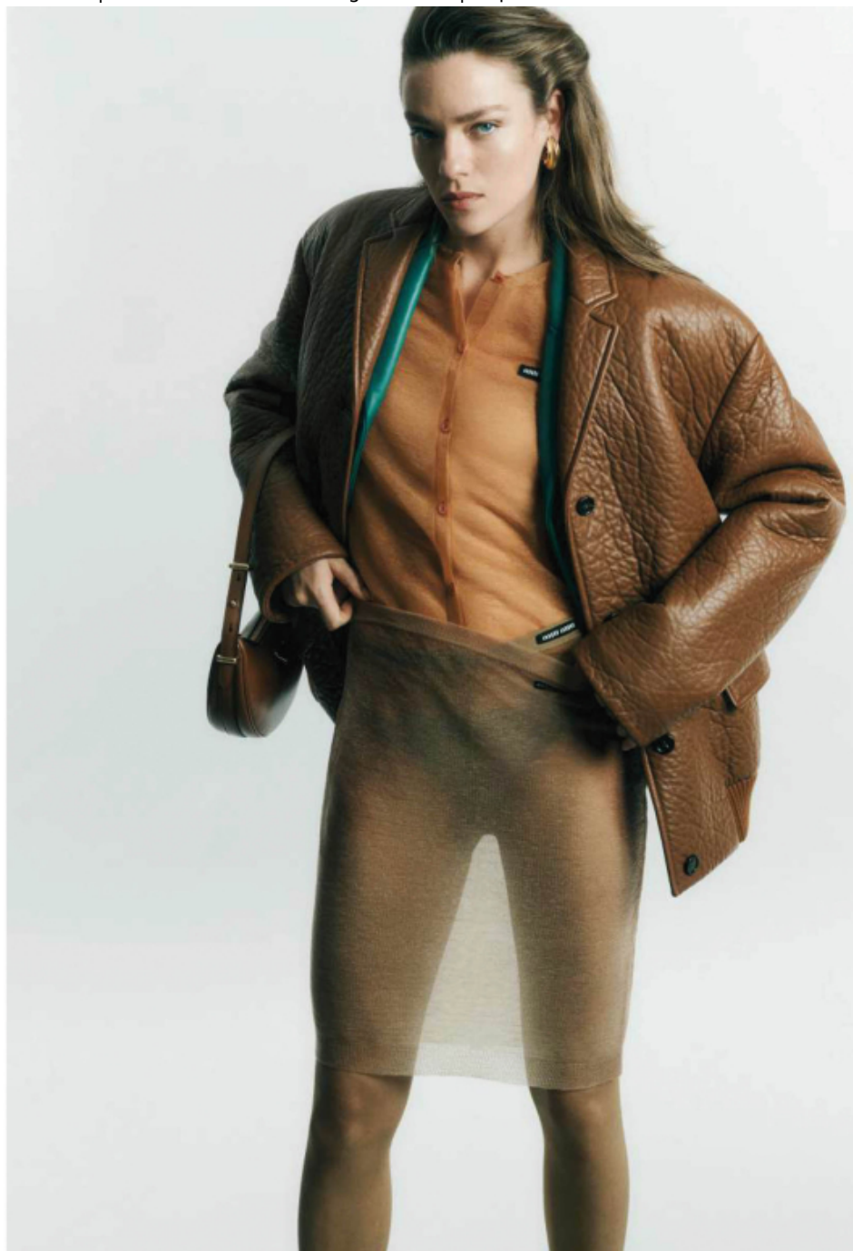
Veste, cardigan, jupe et collant, MIU MIU. Boucles d'oreilles, DAPHINE. Sac, PRADA.