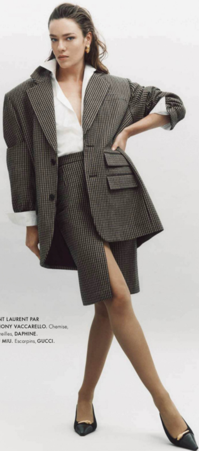
Veste et jupe, SAINT LAURENT PAR ANTHONY VACCARELLO . Chemise, PRADA . Boucles d'oreilles, DAPHINE . Collant, MIU MIU . Escarpins, GUCCI .