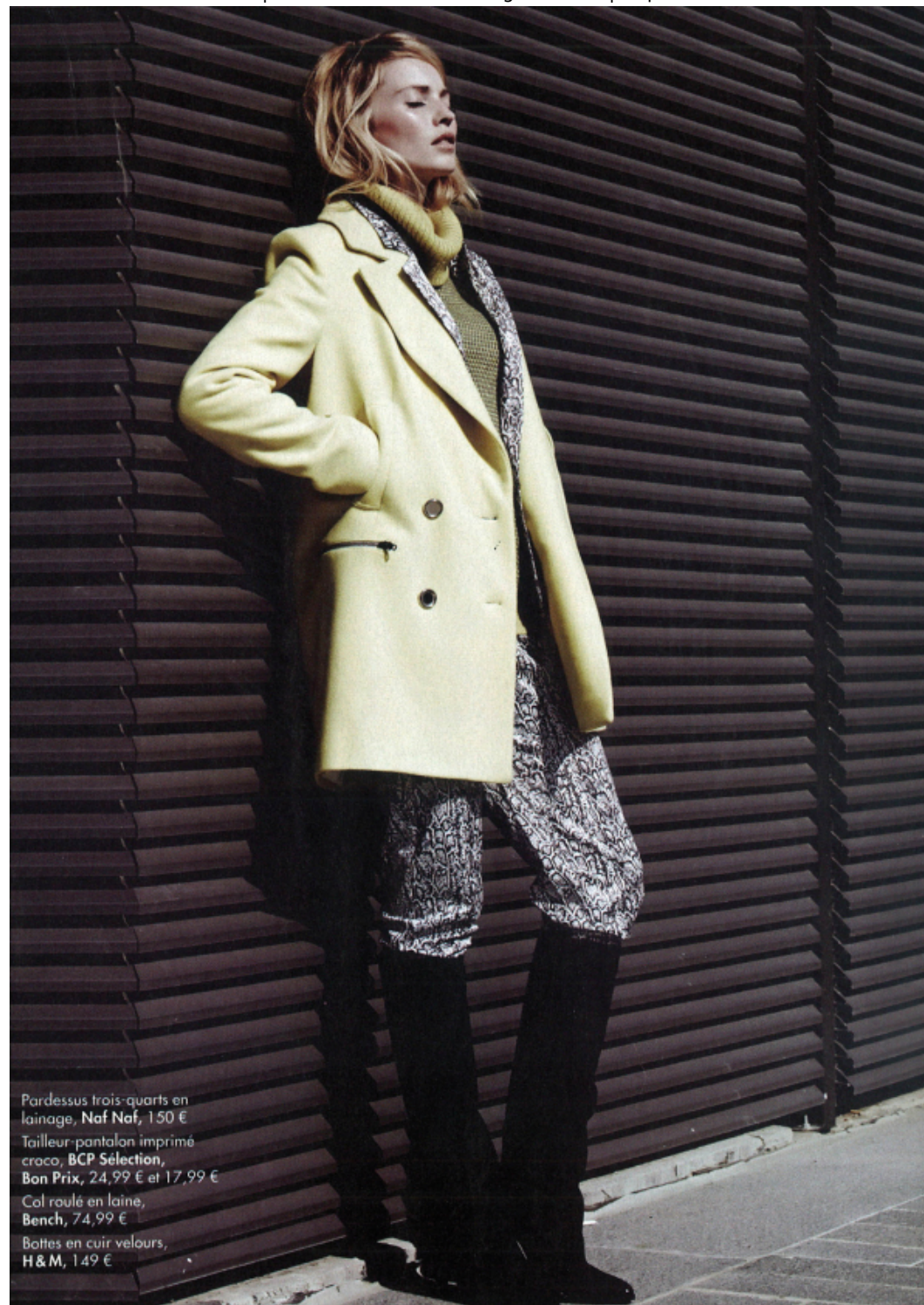
Pardessus trois-quarts en lainage, Naf Naf, 150 € Tailleur-pantalon imprimé croco, BCP Sélection, Bon Prix, 24,99 € et 17,99 € Col roulé en laine, Bench, 74,99 € Bottes en cuir velours, H&M, 149 €