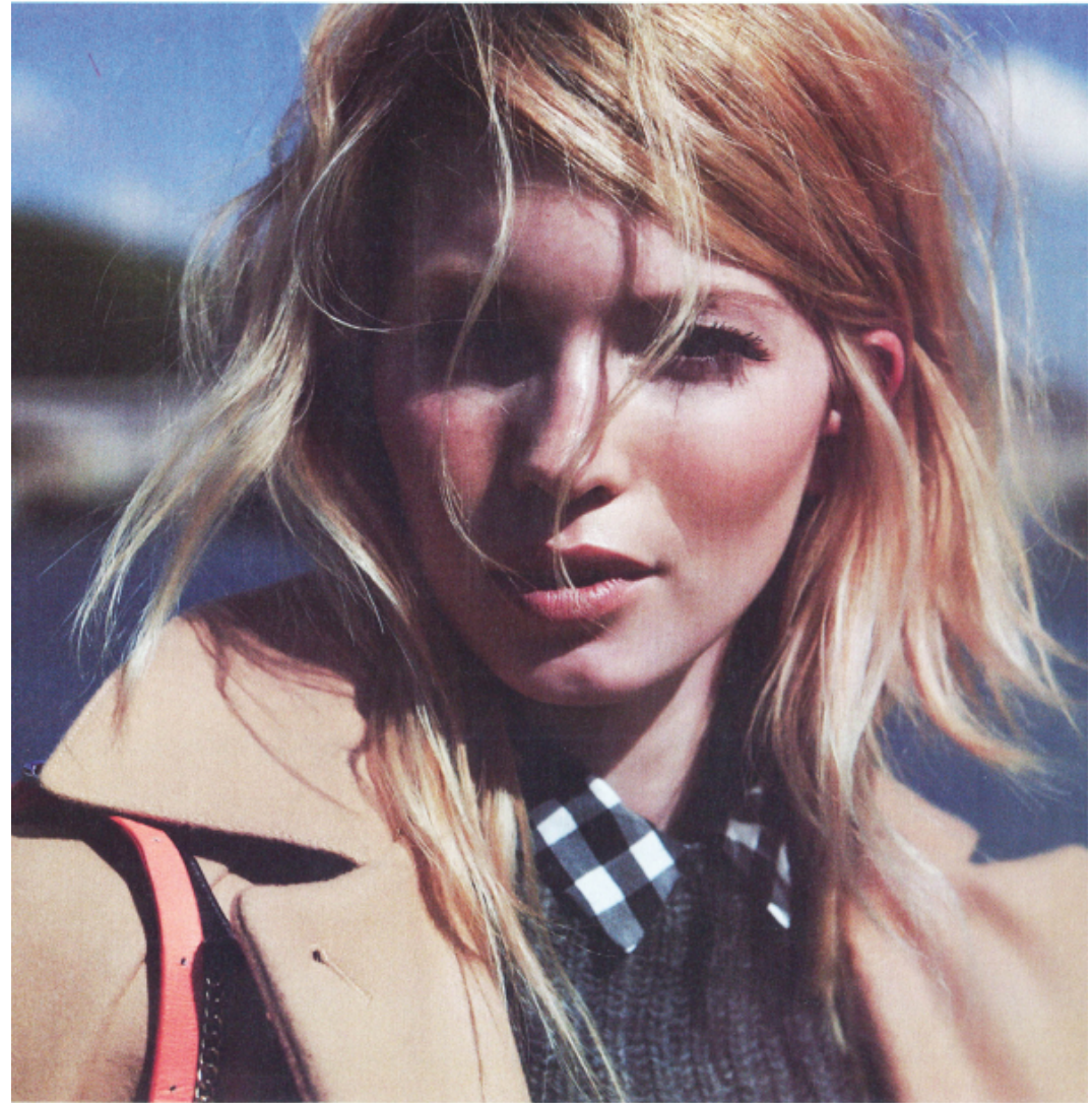
Manteau en drap de laine, New Man, 355 € • Chemise en coton, Mango, 29,99 € • Pull côtelé, Etam, 39,90 € • Pantacourt en gabardine, Suncoo, 69 € • Besace « Zebra », Petite Mendigote, 125 € • Sac à bandoulière abricot, Boohoo, 22 € • Loafers en cuir, Zign, 90 €