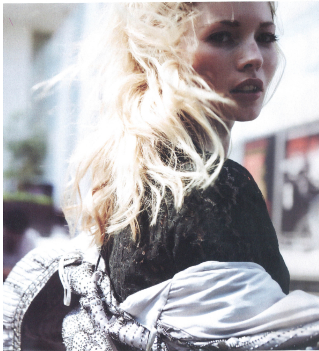
Boléro pailleté, New Look , 39,99 € • Tunique en dentelle, Monoprix , 49,99 € • Pantalon army en satin, H&M , 59,99 € Sac en cuir, Aridza Bross , 300 € • Chaussettes, Uniqlo , 2,90 € • Sandales, Zara , 69,95 €