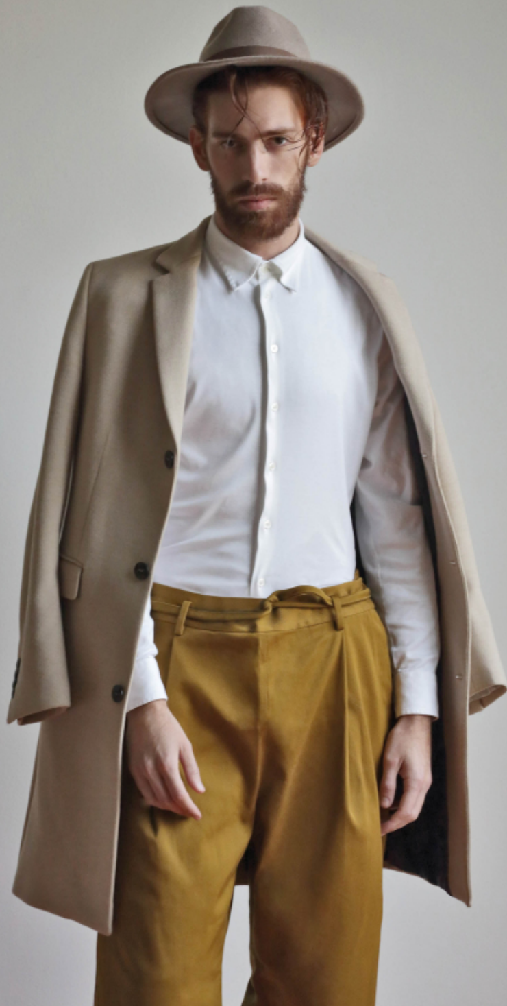
Hat: BORSALINO Coat: ZARA Shirt: EMPORIO ARMANI Trousers: COS