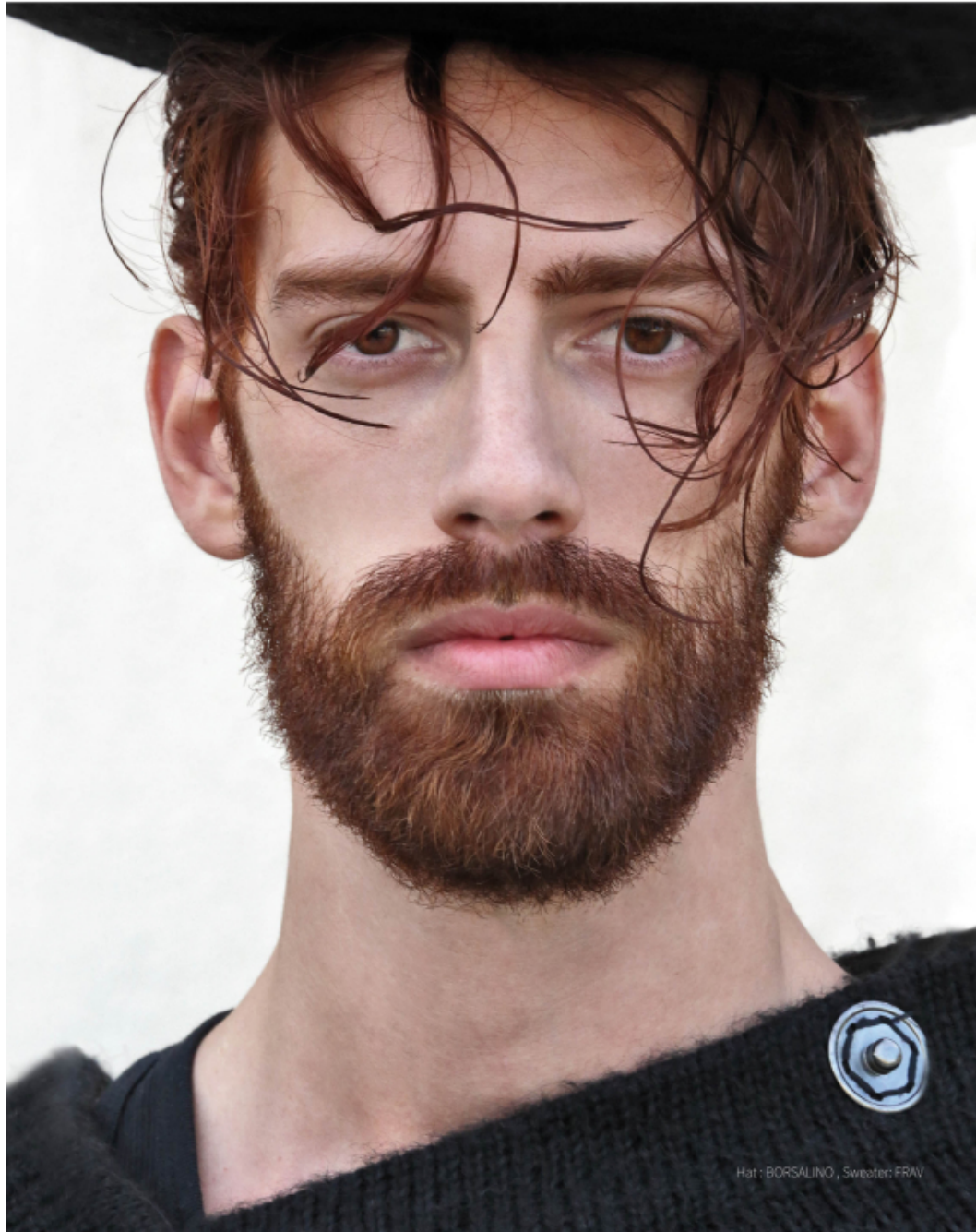
Hat: BORSALINO, Sweater: FRAV