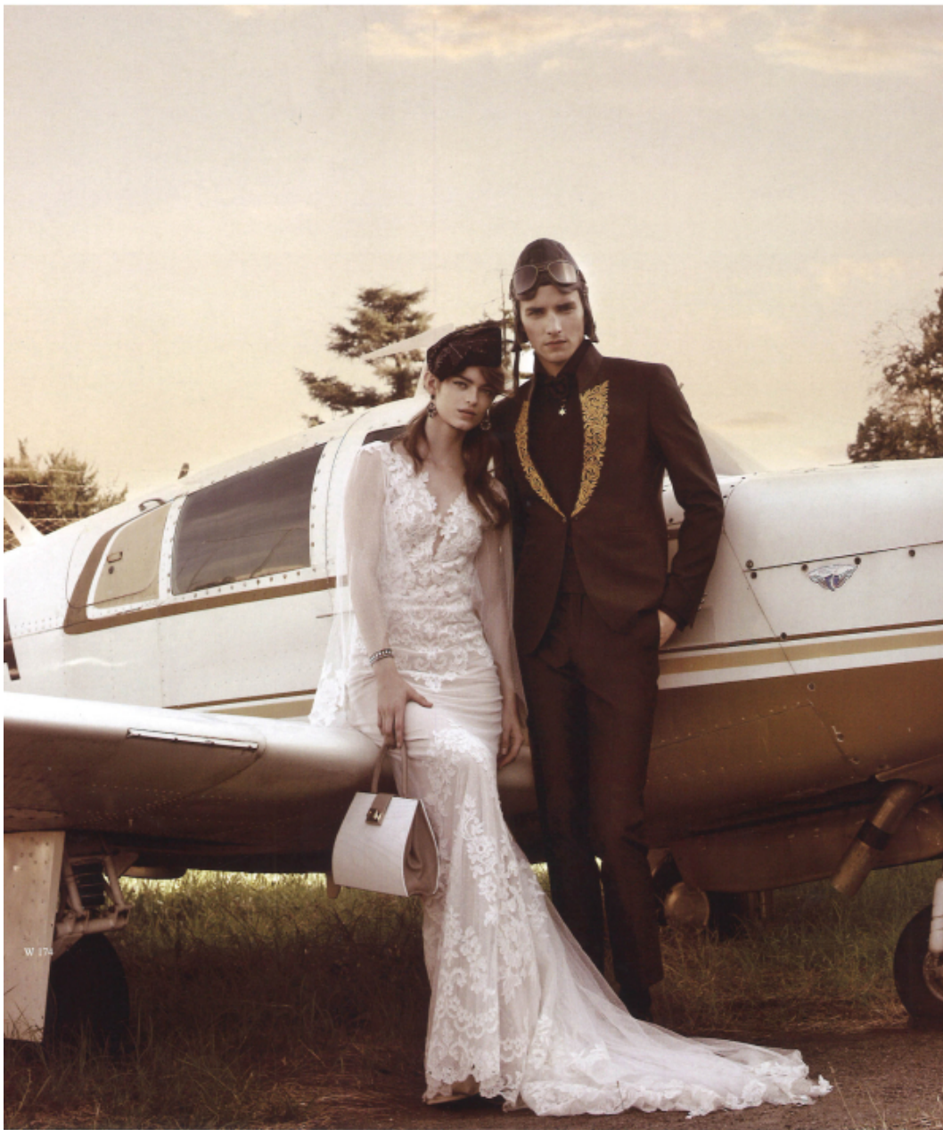
LEI ABITO GALVAN SPOSA CAPPELLO AZZALEN BORSA GIO BASTIAN BRACCIALI BIJOU BRIGITTE LUI ABITO CARLO PIGNATELLI CERIMONIA CAPPELLO E OCCHIALI AVIATORE AN.G.E.L.O. VINTAGE PALACE