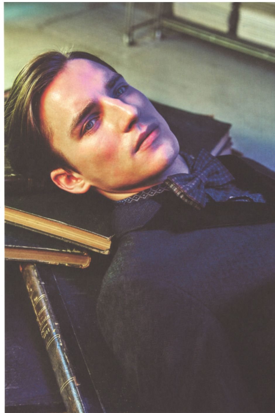
Nella pagina accanto: smoking monopetto in raso di lana con pantaloni fiat-front e camicia in popeline di cotone, CORNELIANI. Papillon in seta, LANIERI. Stringate in vitello con fondo in gomma, BERLUTI