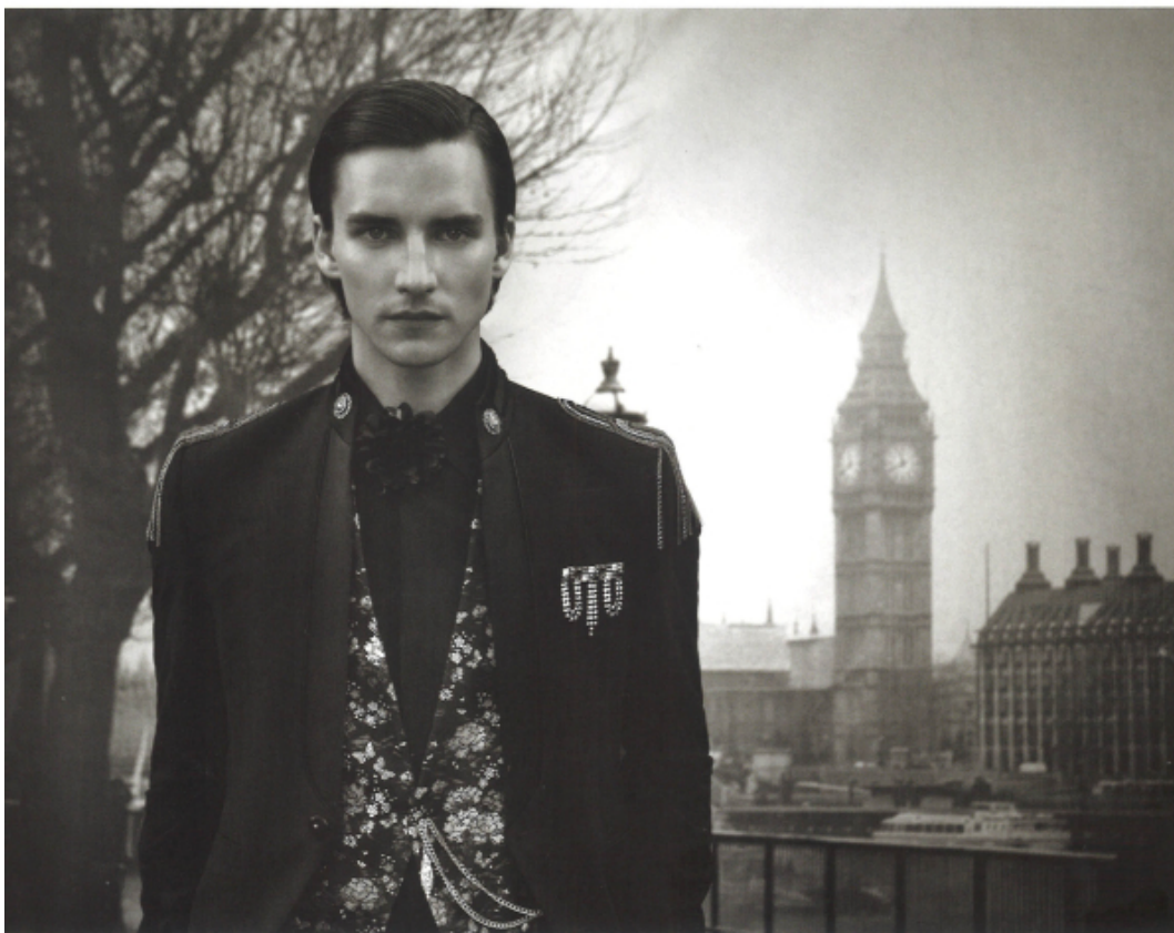
ABITO E ACCESSORI CARLO PIGNATELLI CERIMONIA