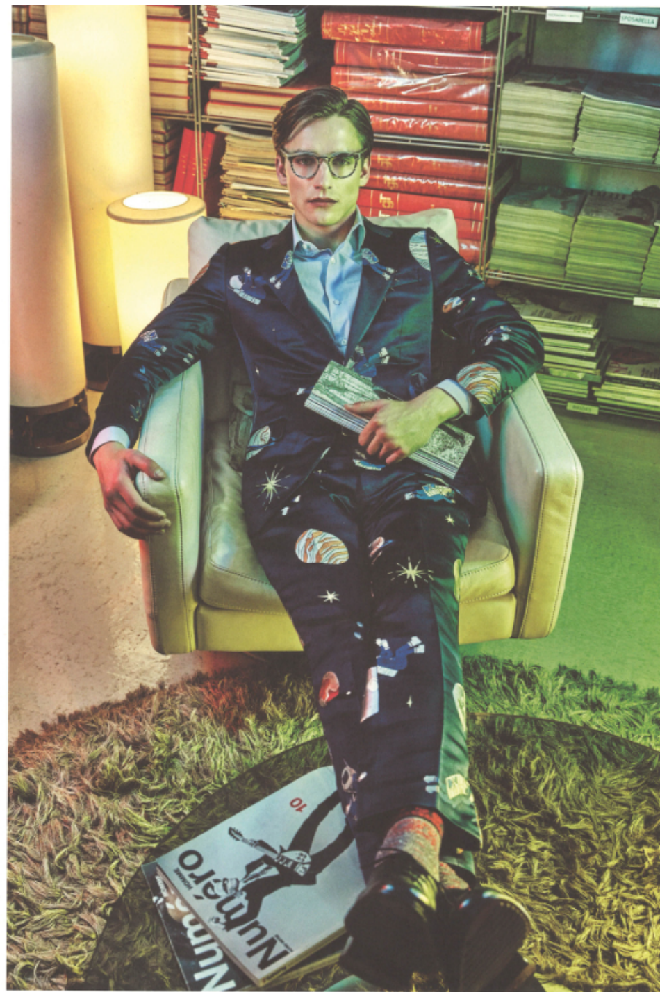
Smoking monopetto un bottone in viscosa con pantaloni flat-front e camicia in popeline di cotone, tutto CARUSO. Occhiali da vista in acetato, DOLCE&GABBANA Oxford in vitello spazzolato, GEDX. Calze in lana e lures, ALTO MILANO