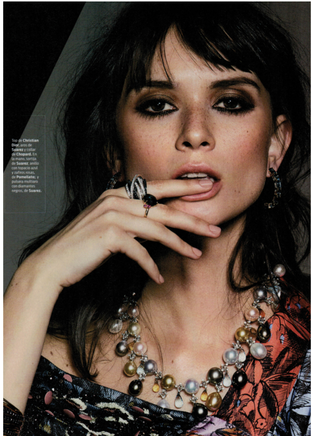
Top de Christian Dior, aros de Suárez y collar de Chopard. En la mano, sortija de Suárez; anillo con topacio azul y zafiros rosas, de Pomellato; y pulsera multiaro con diamantes negros, de Suárez.