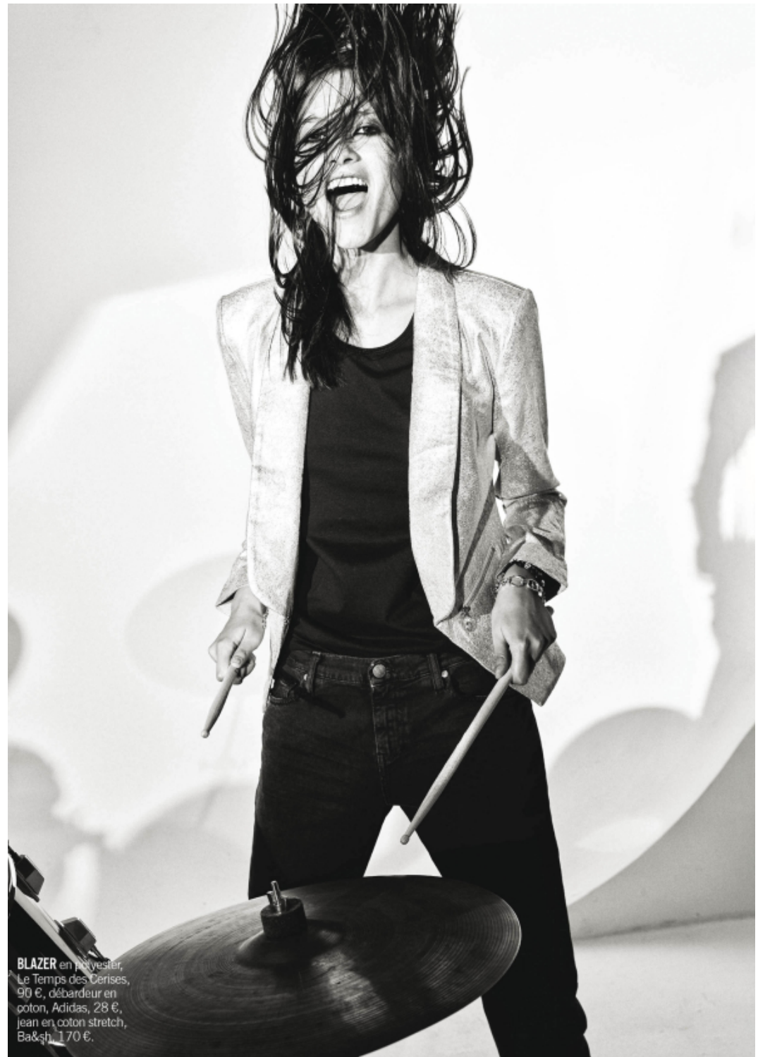
BLAZER en polyester, Le Temps des Cerises, 90 €, débardeur en coton, Adidas, 28 €, jean en coton stretch, Ba&sh, 170 €.