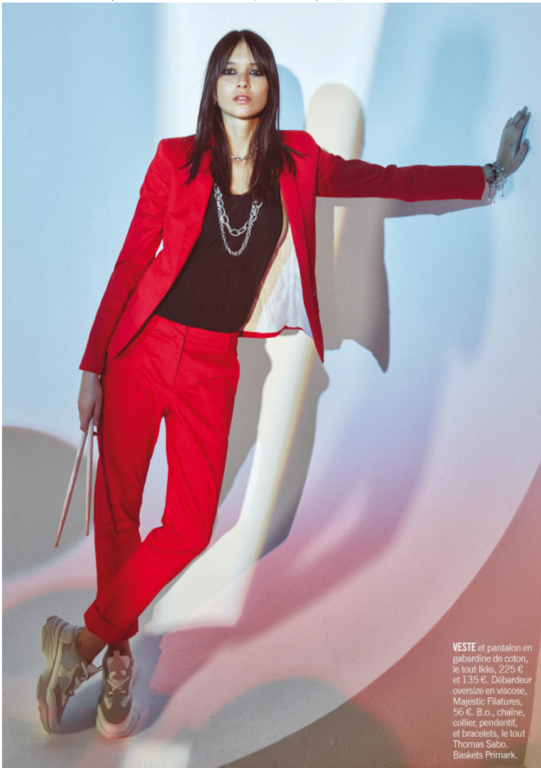
VESTE et pantalon en gabardine de coton, le tout Ikks, 225 € et 135 €. Débardeur oversize en viscose, Majestic Filatures, 56 €. B.o., chaîne, collier, pendentif, et bracelets, le tout Thomas Sabo. Baskets Primark.