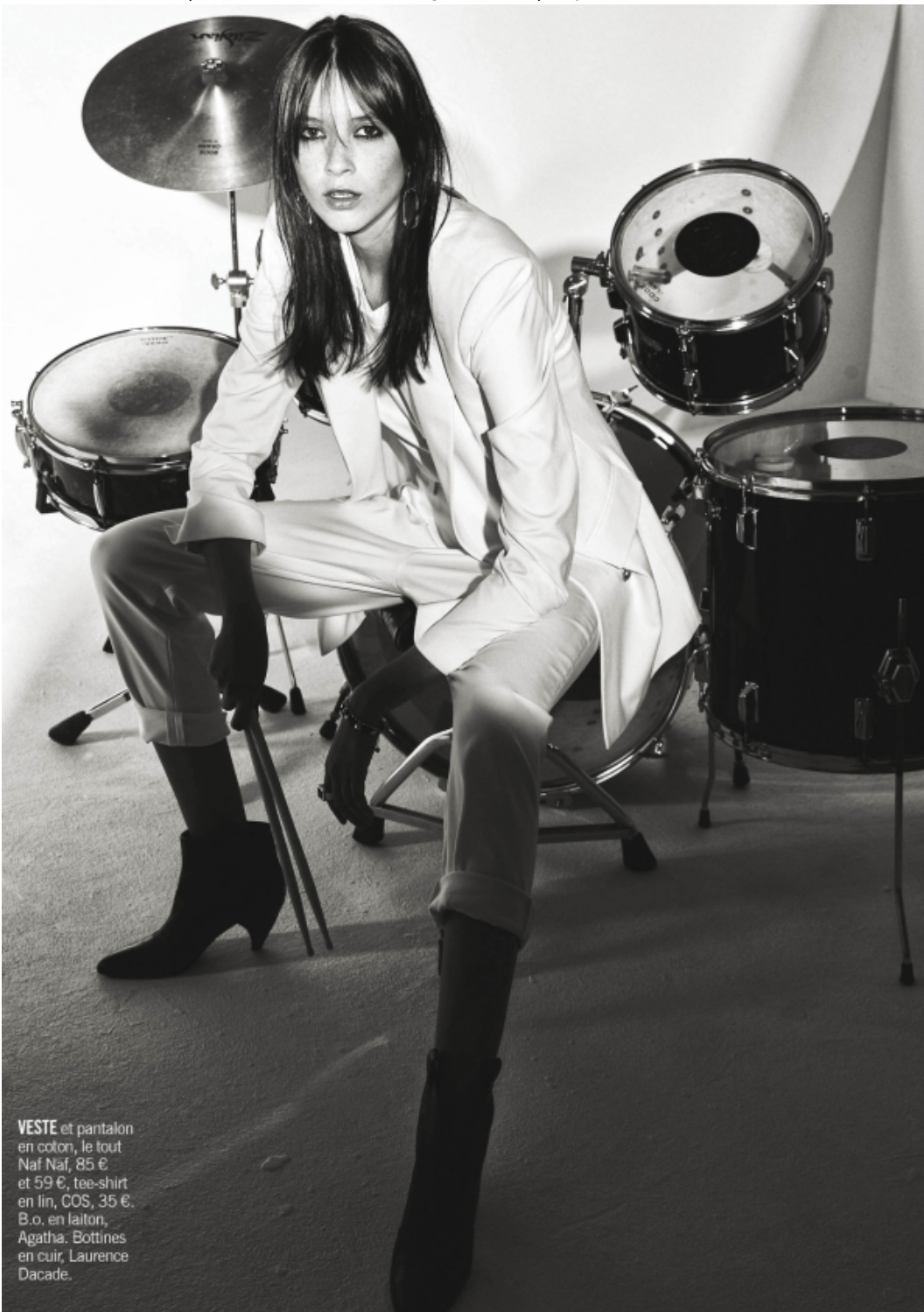
VESTE et pantalon en coton, le tout Naf Naf, 85 € et 59 €, tee-shirt en lin, COS, 35 €. B.o. en laitton, Agatha. Bottines en cuir, Laurence Dacade.